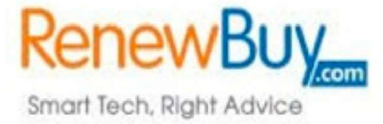
-ప్రథమ దశలో ఎల్ఐసి, ఐసిఐసిఐ ప్రుడెన్షియల్, డిజిట్ ఇన్సూరెన్స్ తో భాగస్వామ్యం