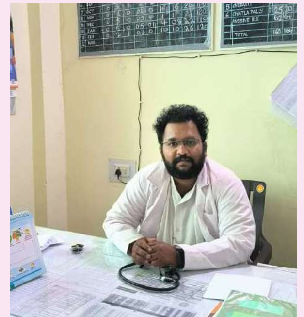
జగదేవపూర్ జనవరి 10 (ప్రజాజ్యోతి)