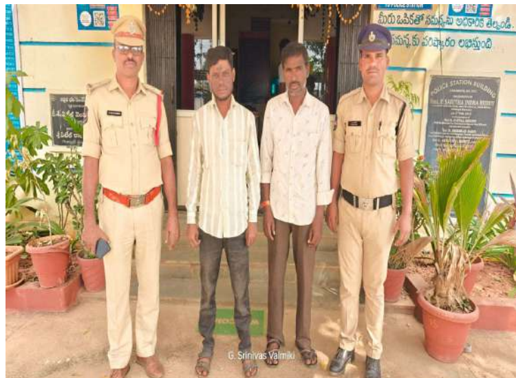
మేరకు డ్రంక్ అండ్ డ్రైవ్ తనిఖీలతో పాటు 18 ఏళ్ల లోపు వయసున్న మైనర్లు వాహనాలు నడిపితే కఠిన చర్యలు తప్పవని హెచ్చరించారు.