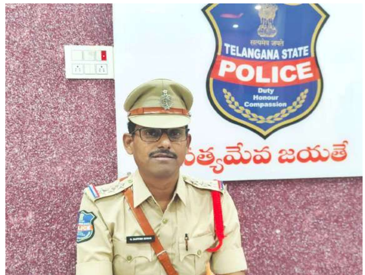
ఐఎఎస్ ముందు హాజరపరచగా కేసును పరిశీలించిన తదుపరి పై విధంగా తీర్పు వెల్లడించారాని సీబి పేర్కొన్నారు.