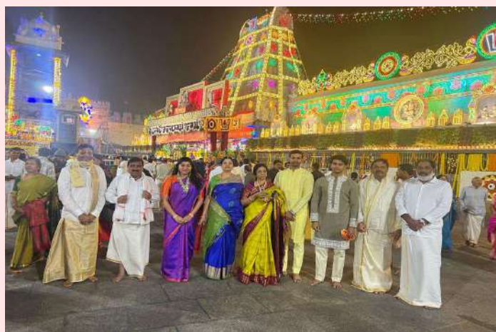
చేవెళ్ల జనవరి 10(ప్రజా జ్యోతి):