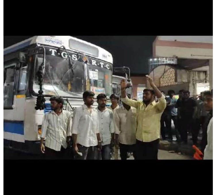
-జడ్పర్ల ఆర్టీసీ బస్టాండ్లో ఆందోళన దిగిన ప్రయాణికులు ఏబీవీపీ కార్యకర్తలు

జడ్పర్ల : జనవరి 10 (ప్రజా జ్యోతి) సంక్రాంతి పండుగ నేపథ్యంలో ఆర్టీసీ చార్జీలు అమాంతంగా పెంచడంతో ప్రయాణికులు ఆందోళనకు దిగారు. ప్రయాణికులకు ఎలాంటి ముందస్తు సమాచారం లేకుండా ప్రభుత్వం ఇష్టారీతిగా ఆర్టీసీ చార్జీలు పెంచినది ఆగ్రహం వ్యక్తం చేస్తూ బస్టాండ్ లోనే ఆందోళన చేపట్టడంతో చివరికి పోలీసుల రంగప్రవేశంతో ఆందోళన సర్దు మనిగింది. సంక్రాంతి నేపథ్యంలో ప్రభుత్వం అమాంతంగా ఆర్టీసీ చార్జీలు పెంచినది మహబూబ్ నగర్ జిల్లా జడ్పర్ల బస్టాండ్ లో అటు ప్రయాణికులు ఇటు ఏబీవీపీ నాయకులు ఆందోళనకు దిగారు. జడ్పర్ల నుండి హైదరాబాద్ కు వెళ్ళినప్పుడు ఒక చార్జి ఉంటే హైదరాబాద్ నుండి మళ్ళీ జడ్పర్లకు తిరిగి వచ్చేసరికి రెట్టింపు చార్జీలు వసూలు చేస్తున్నారని పండగ వేల సామాన్యుడు ఆర్టిసి బస్సు ఎక్కాలంటేనే భయపడాలని పరిస్థితి ఏర్పడిందని ఆందోళన వ్యక్తం చేశారు. ఈ నేపథ్యంలో జడ్పర్లకు చెందిన ఓ విద్యార్థి జడ్పర్ల టు హైదరాబాద్