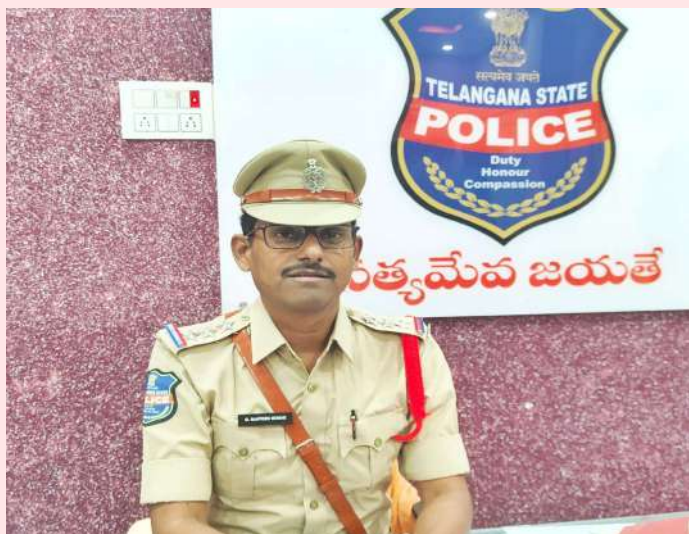
తాండూరు జనపరి 10 ప్రజా జ్యోతి: