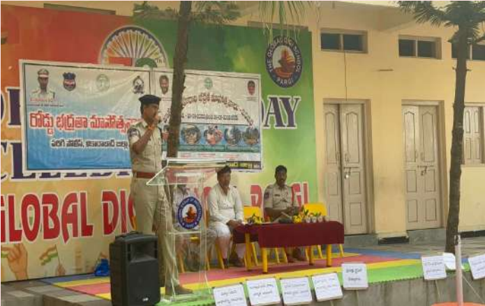
పరిగి, జనవరి 10 (ప్రజా జ్యోతి):

...మధ్యం తాగి వాహనం నడపవద్దు - రోడ్డు భద్రతా వారోత్సవాలు ప్రారంభం - డియస్పి శ్రీనివాస్