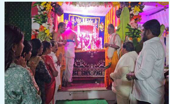
సందిగామ, జనవరి 10(ప్రజాజ్యోతి):