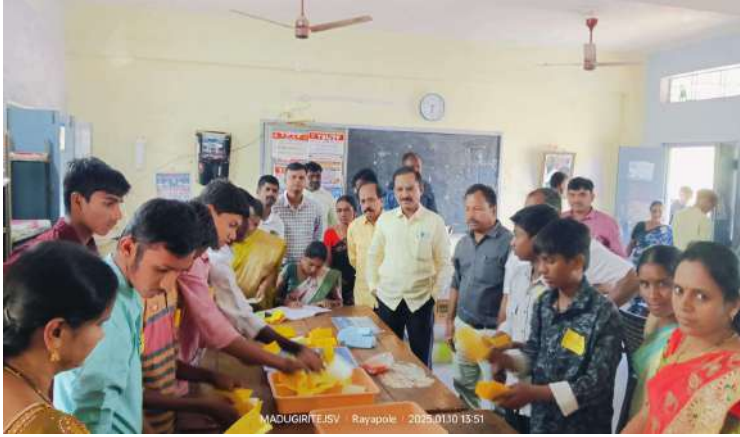
- భావి భారత పౌరులుగా విద్యార్థులు ఎదగాలి