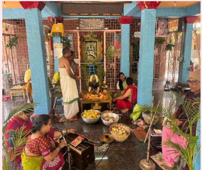
మర్నాళ్ జనవరి 09