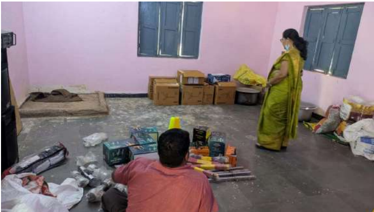
మోమిన్ పెట్ జనపరి 9 ప్రజా జ్యోతి

ఎంపీడీవో విజయలక్ష్మి హాస్టల్లో చదువుకునే విద్యార్థులకు నాణ్యమైన భోజనం అందించాలని ఎంపీడీవో విజయలక్ష్మి సూచించారు గురువారం మోమిన్పేట్ మండల కేంద్రంలో కే జి బి వి హాస్టల్లో ఆకస్మికంగా తనిఖీ చేశారు ఈ సందర్భంగా ఆమె మాట్లాడుతూ చదువుకునే విద్యార్థులకు నాణ్యమైన భోజనం ఇవ్వాలని అన్నారు హాస్టల్లో విద్యార్థులకు ఇబ్బందులకు అలగకుండా చూడాలని అన్నారు బాత్రూం లో టాయిలెట్ రూమ్స్ పరిశుభ్రంగా ఉంచాలని అన్నారు త్రాగటానికి మంచి నీటి సౌకర్యం ఎప్పటికప్పుడు అందుబాటులో ఉండే విధంగా చూడాలని ఆమె కోరారు రాత్రివేళ విద్యార్థుల పండుకునే రూంలో కరెంటు లైట్లు వెలిగే విధంగా ఉండాలని నైట్ వాచ్మెన్ ఉండాలని రాత్రిపూట రోజుకు ఒక టీచరు చొప్పున డ్యూటీ చేయాలని ఆమె సూచించారు వారి ఆకామిడేశన్ సంబంధిత అధికారులు చూసుకోవాలని అన్నారు హాస్టల్లో అన్ని