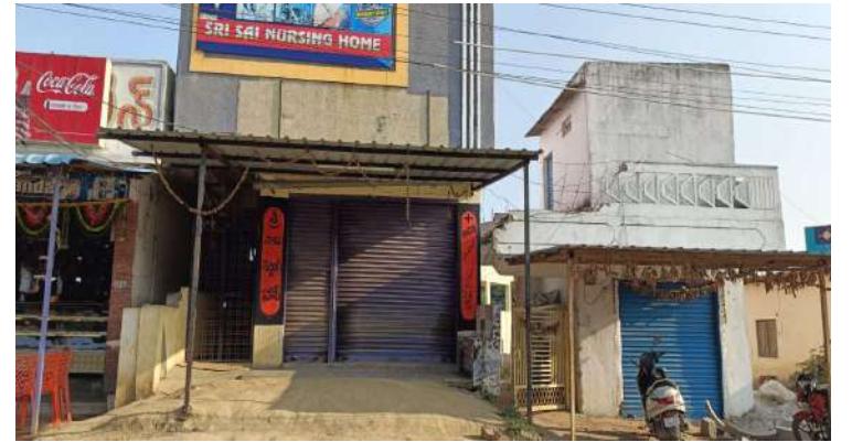
చేసేదేమిలేక నిర్వాహకులు అసుపత్రికి గురువారం తాళం వేసుకోవడం జరిగినది.