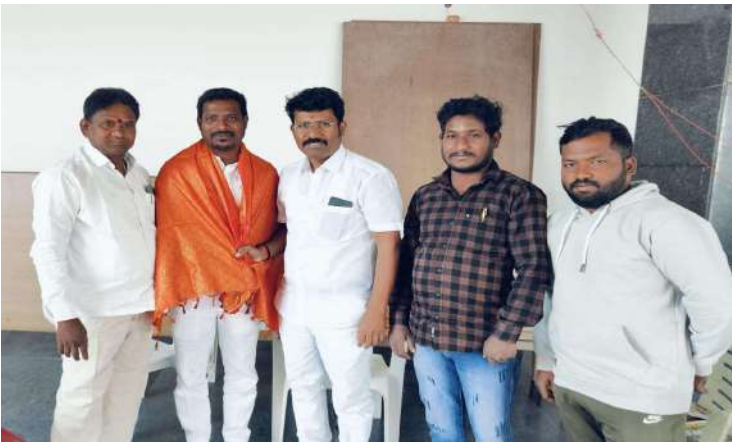
బషీరాబాద్ జనవరి 9 ప్రజాజ్యోతి

తెలంగాణ రాష్ట్ర భారతీయ జనతా పార్టీ ఆదేశాల మేరకు వికారాబాద్ జిల్లాలో పలు మండలాల నూతన బిజెపి మండల అధ్యక్షులను గ్రామాలలోని కమిటీల నుంచి అభిప్రాయ సేకరణ చేపట్టి మెజారిటీ సభ్యులు అభిప్రాయం మేరకు మండల అధ్యక్షులను నియమించడం జరిగింది. బషీరాబాద్ మండల బిజెపి అధ్యక్షుడిని ఎన్నికల రిటర్నింగ్