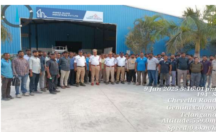
9 Jan 2025 5:16:01 pm 19° S Chevella Road Gemini Colony Telangana Altitude:559.0m Speed:0.6km/h