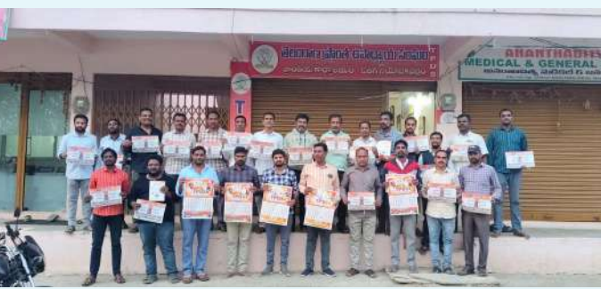
పరిగి, జనవరి 09 (ప్రజాజ్యోతి):