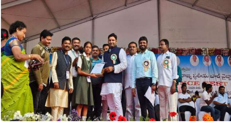
- రాష్ట్రస్థాయి వైజ్ఞానిక్ ప్రదర్శన 2024-25