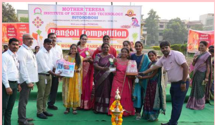
సత్తుపల్లి జనవరి 9 ప్రజా జ్యోతి.