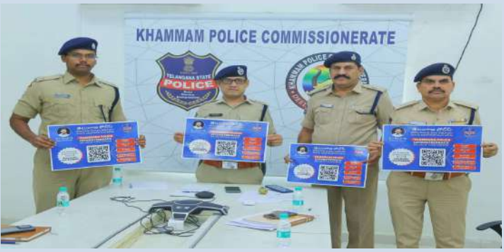
ఖమ్మం ప్రతినిధి ప్రజా జాతి

-క్యూఆర్ కోడ్ ఆఫ్ సిటిజెన్ ఫోస్టర్లను ప్రారంభించిన పోలీస్ కమిషనర్