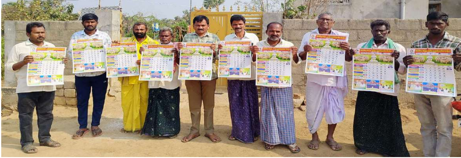
పెనుబల్లి, జనవరి 09, ప్రజాజ్యోతి: