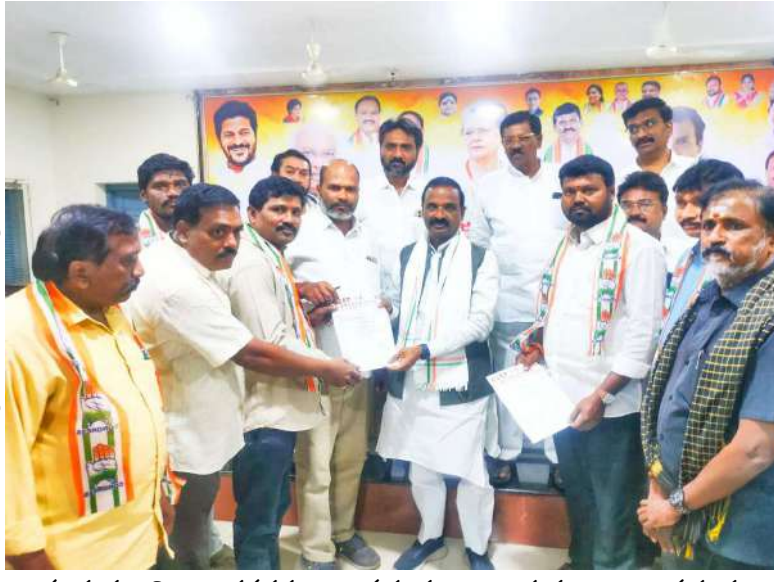
కూసుమంచి ఆళ్లగడప నాగభూషణం, తుముల నాగభూషణం తదితరులు పాల్గొన్నారు.