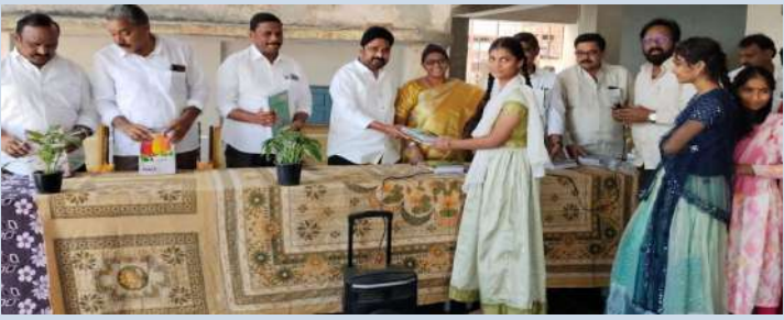
సత్తుపల్లి జనవరి 9 ప్రజా జ్యోతి.

-మట్టా ఆరోగ్యం వర్తంతి సందర్భంగా పాఠశాలకు 5లక్షల వితరణ.