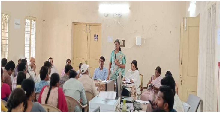
-నేటి నుంచి గ్రామ సభలు ప్రారంభం