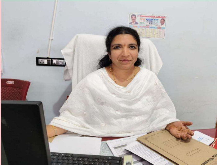
పాలేరు జనవరి 20 ప్రజా జ్యోతి