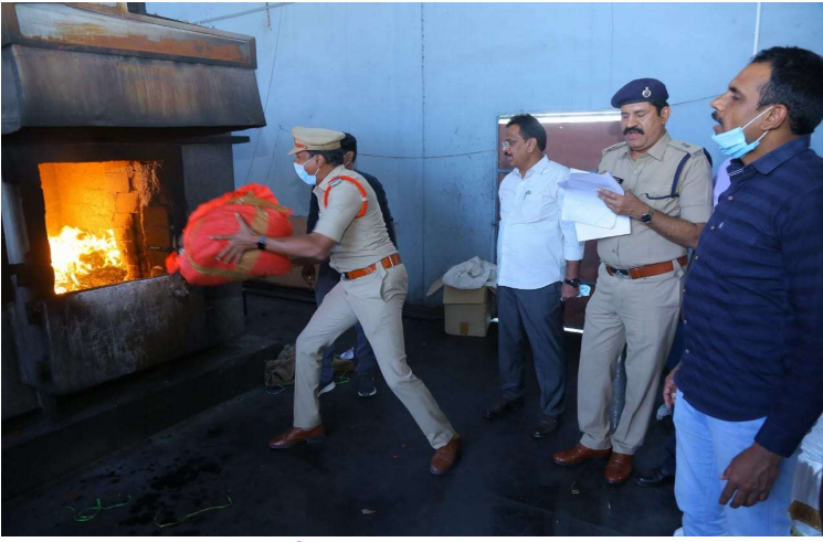
ఖమ్మం ప్రతినధి ప్రజా జ్యోతి