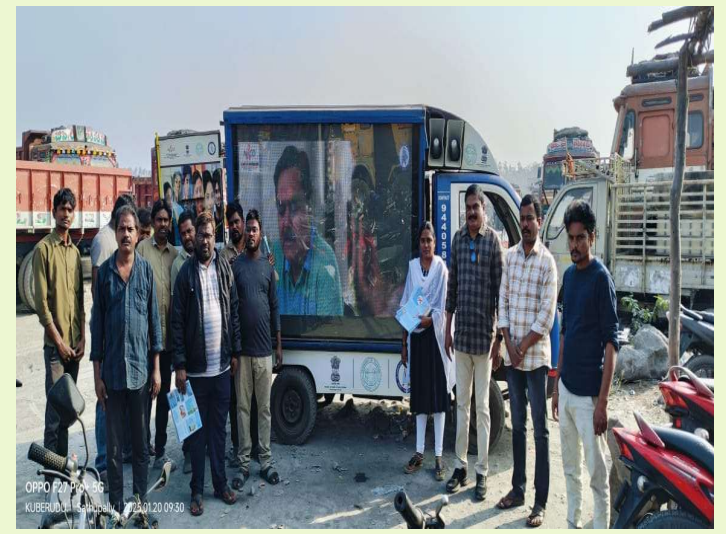
సత్తుపల్లి జనవరి20ప్రజా జ్యోతి.