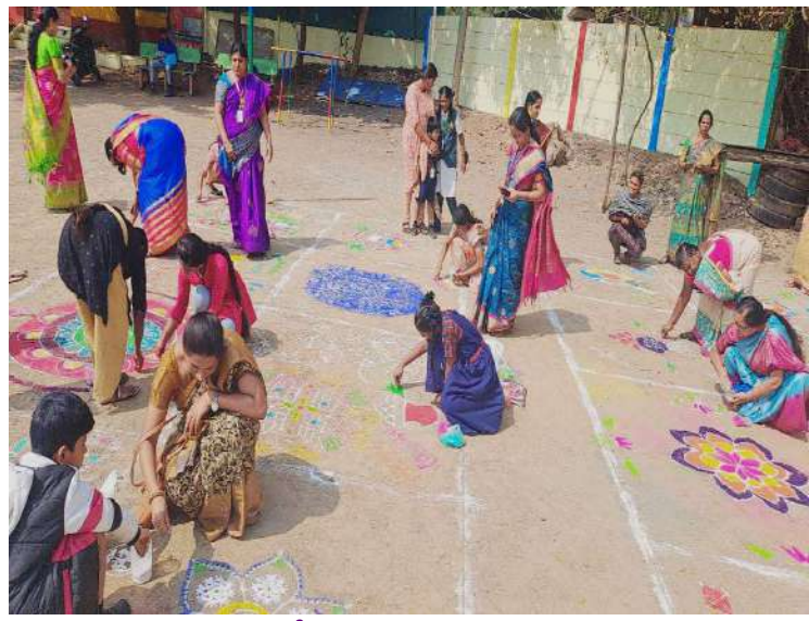
ఖమ్మం ప్రతినిధి ప్రజా జ్యోతి