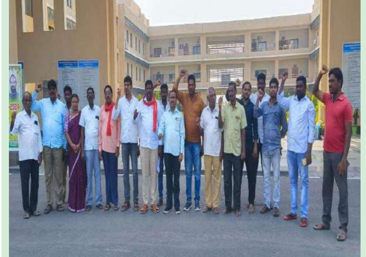
భాసుపురి /జిల్లా కలెక్టర్ కార్యాలయం