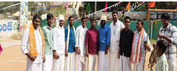
పెనుబల్లి, జనవరి 10, ప్రజాజ్యోతి :

పెనుబల్లి మండల కేంద్రంలోని విఎం బంజర అరుణోదయ మెరిట్ స్కూల్లో శుక్రవారం ముందస్తు సంక్రాంతి సంబరాలు రంగరంగ వైభవంగా జరిగాయి. అరుణోదయ పాఠశాలలో ముందస్తు సంక్రాంతి వేడుకలు జోరుగా సంప్రదాయాలు ఉట్టిపడేలా విద్యార్థినులు సందడి చేశారు. రంగవల్లులతో పండుగకు కొత్త శోభ తీసుకొచ్చారు. ఏటా సంక్రాంతి పండుగ వేడుకలు పాఠశాలలో ఘనంగా నిర్వహించుకోవడం ఆనవాయితీ. ఈసారి కూడా అదే ఉత్సాహంతో తెలుగుదనం ఉట్టిపడేలా సంప్రదాయాలను గౌరవిస్తూ రంగరంగుల ముగ్గులు, పిండి వంటలు, గాలిపటాల పోటీలు వంటి ఆటలతో అరుణోదయ పాఠశా వర్తకోభితమైంది. సంక్రాంతి ప్రాముఖ్యతను తెలియజేస్తూ విద్యార్థులు ప్రదర్శించిన సాంస్కృతిక కార్యక్రమాలు విశేషంగా ఆకట్టుకున్నాయి. చిన్నారుల సాంప్రదాయ నృత్యాలు, గీతాలాపనలు ప్రత్యేక ఆకర్షణగా నిలిచాయి. పల్లె వాతావరణంలో సంక్రాంతి పండుగ వేడుకను కళ్లకు కట్టినట్లు చూపించారు. విద్యార్థులు ప్రత్యేకంగా ఏర్పాటు చేసిన పూరి గుడిసెల్లో నివాసం, గంగిరెద్దుల విన్యాసం, పిండి వంటలు, బొమ్మల కొలువులు విశేషంగా ఆకట్టుకున్నాయి. ఈ సందర్భంగా స్కూల్ కరస్పాండెంట్ శంకర్, శ్రీనులు మాట్లాడుతూ సకల సౌభాగ్యాలను