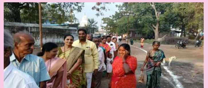
మధిర ఆర్పి ప్రజా జ్యోతి

మధిర రామాలయంలో ఈ రోజున ముక్కోటి ఏకాదశి సందర్భంగా భక్తులు అధిక సంఖ్యలో పాల్గొన్నారు. ఉదయం ఐదు గంటల నుంచి ఉత్తర ద్వార దర్శనం ద్వారా భక్తులు భగవంతుని దర్శించుకుని తీర్థప్రసాదాలు స్వీకరించారు. భక్తులకు ఎటువంటి అసౌకర్యం కలగకుండా ఈవో, దేవాలయ సిబ్బంది అర్చకులు సౌకర్యాలు కలగ చేసినారని ఆలయ సిబ్బంది తెలిపారు.