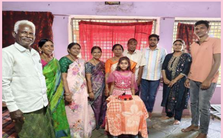
తల్లాడ, జనవరి 10 (ప్రజా జ్యోతి న్యూస్):