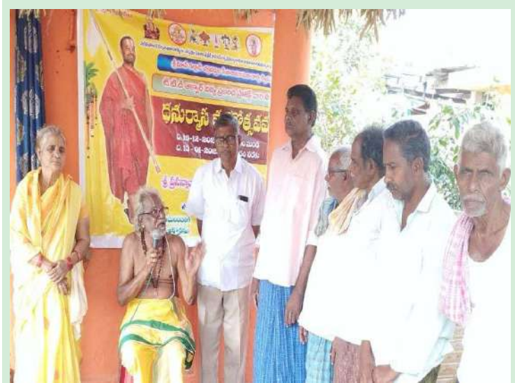
పెనుబల్లి, జనవరి 09, (ప్రజాజ్యోతి):

-ప్రవచనకర్త: నల్లాన్ చక్రవర్తుల సీతారామానుజాచార్య