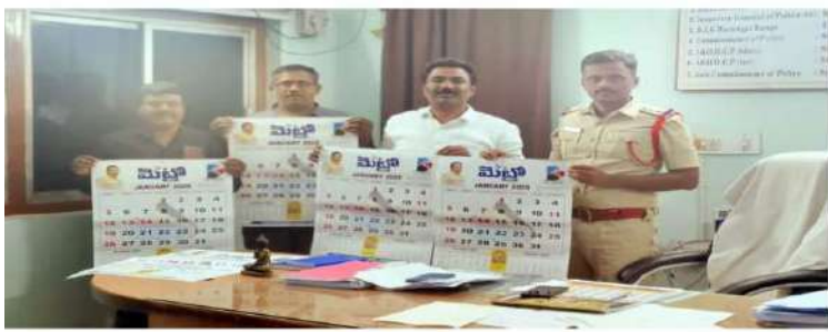
ఖమ్మం మెట్రో ప్రతినిధి

మెట్రో ఈవినింగ్ నూతన సంవత్సర క్యాలెండర్ను ఆవిష్కరించిన పోలీస్ స్టేషన్ సిబ్బంది ఈ సందర్భంగా మాట్లాడుతూ ప్రజలకు ప్రభుత్వానికి సారథులుగా నీతి నిజాయితీ నిర్భతత కలిగి ఉండి ప్రజలతో మమేకమై కలిగి ప్రజలకు ప్రభుత్వానికి నిర్భయంగా వార్తలు రాస్తూ మంచి గుర్తింపు తెచ్చుకోని మంచి చేసే కార్యక్రమాల్లో పాల్గొని, మంచిగా నిర్భయంగా వార్తలు రాస్తూ ముందుకు సాగాలని అన్నారు. ఈ