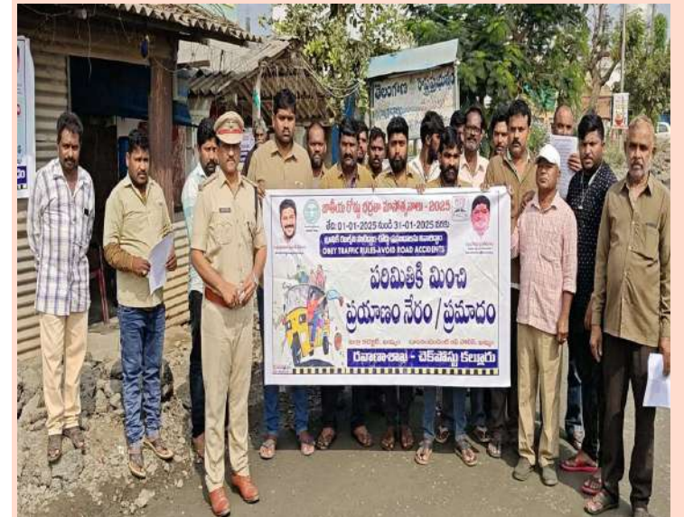
పెనుబల్లి, జనవరి 03, ప్రజాజ్యోతి :