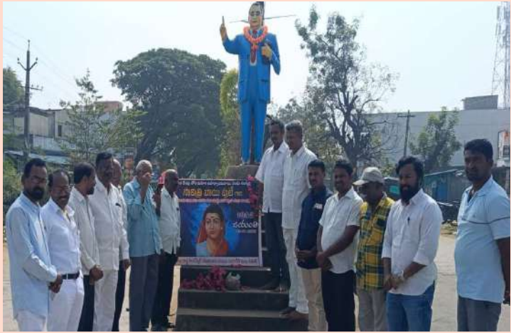
కారేపల్లి, జనవరి 3, ప్రజా జ్యోతి: