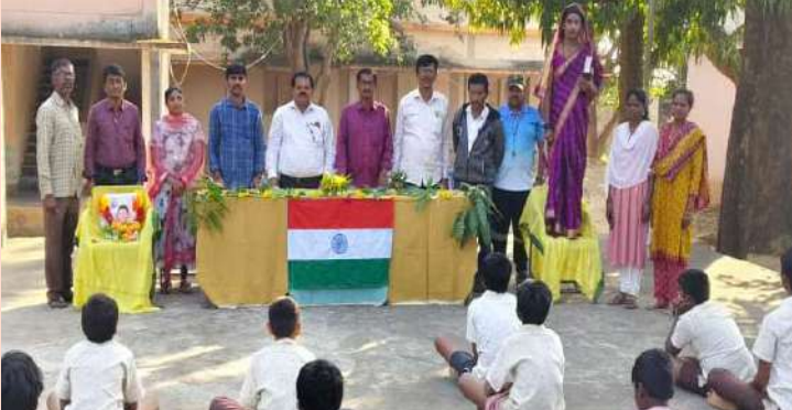
కారేపల్లి, జనవరి 3, ప్రజా జ్యోతి: