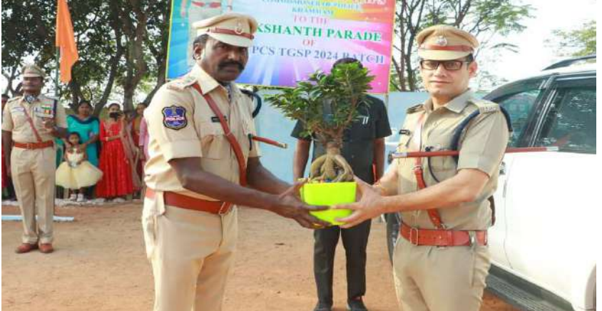
మినిస్ట్రీయల్ స్టాఫ్ మరియు ఆఫీసర్స్, కానిస్టేబుల్ ఆఫీసర్స్, హౌం గార్డ్స్ మరియు ఔట్ సోర్సింగ్ సిబ్బంది, వారి కుటుంబ సభ్యులు, మరియు బ్రామ్మ కుమారి సమాజం సభ్యులు పాల్గొన్నారు.