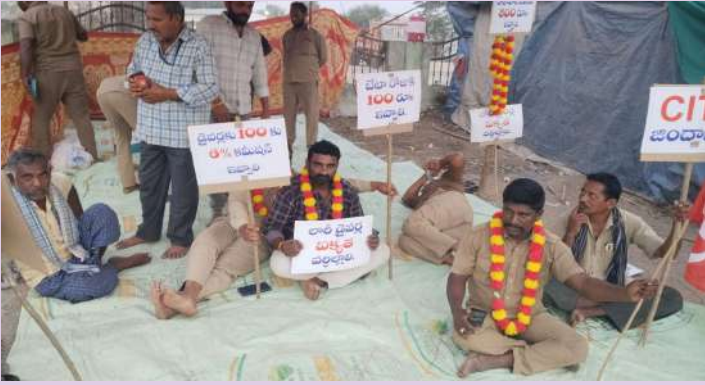
ప్రజా జ్యోతి మధిర