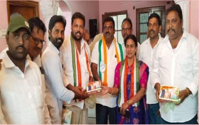
కల్లూరు జనవరి 03(ప్రజా జ్యోతి):

-జర్నలిస్టులకు స్వీట్లు పంపిణీ చేసిన ఏనుగు సత్యంబాబు