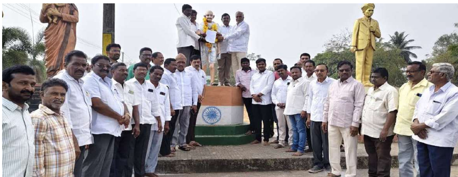
-కాంగ్రెస్ పాలన పై గాంధీకి వినతి పత్రం బి ఆర్ ఎస్ నాయకులు.