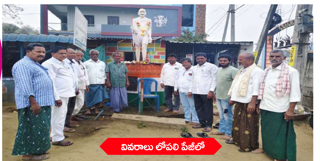
వివరాలు లోపలి పేజీలో