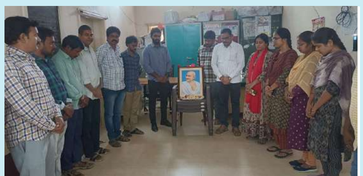
మధిర ఆర్పి ప్రజా జ్యోతి