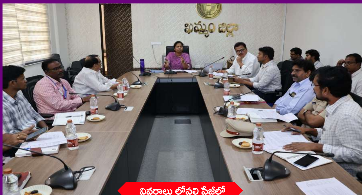
వివరాలు లోపలి పేజీలో

నిర్దేశిత సమయంలోగా టిజి ఐపాస్ దరఖాస్తులను పరిష్కరించాలి