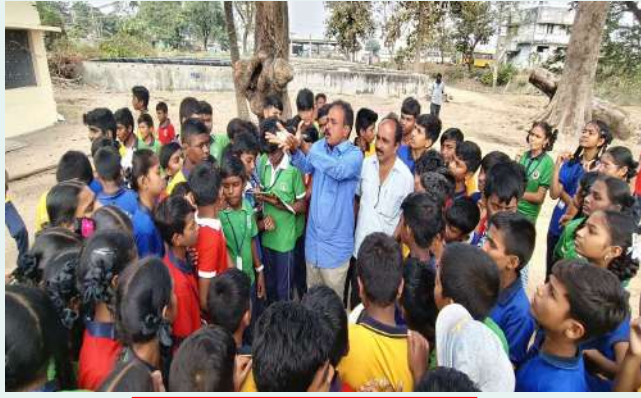
వివరాలు లోపలి పేజీలో

పర్యాటక ప్రాంతాన్ని సందర్శించిన డాన్ బోస్కో విద్యార్థులు