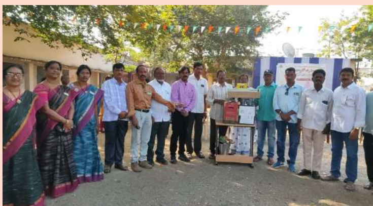
కారేపల్లి, జనవరి 26, ప్రజా జ్యోతి: