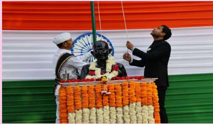
ఖమ్మం ప్రతినిధి ప్రజా జ్యోతి

-జాతీయ పతాకాన్ని ఆవిష్కరించిన కలెక్టర్ ముజమ్మిల్ ఖాన్