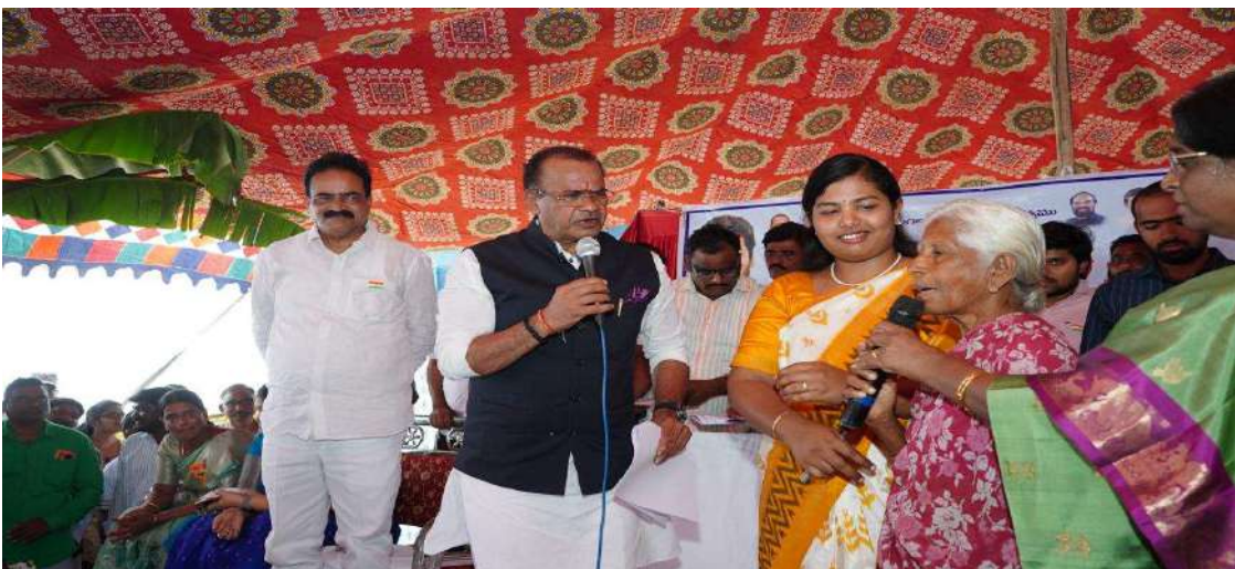
-ప్రజలకు ఇచ్చిన ప్రతి హామీ క్రమ పద్ధతిలో అమలు చేస్తాం రాష్ట్ర రోడ్లు, భవనాలు, సినిమాటోగ్రఫీ మంత్రివర్యులు, ఉమ్మడి ఖమ్మం జిల్లా ఇంచార్జి మంత్రివర్యులు కోమటి రెడ్డి వెంకట్ రెడ్డి

-21 వేల కోట్లతో 25 లక్షల రైతులకు రుణమాఫీ పూర్తి ఖమ్మం ప్రజలది ప్రజా జ్యోతి