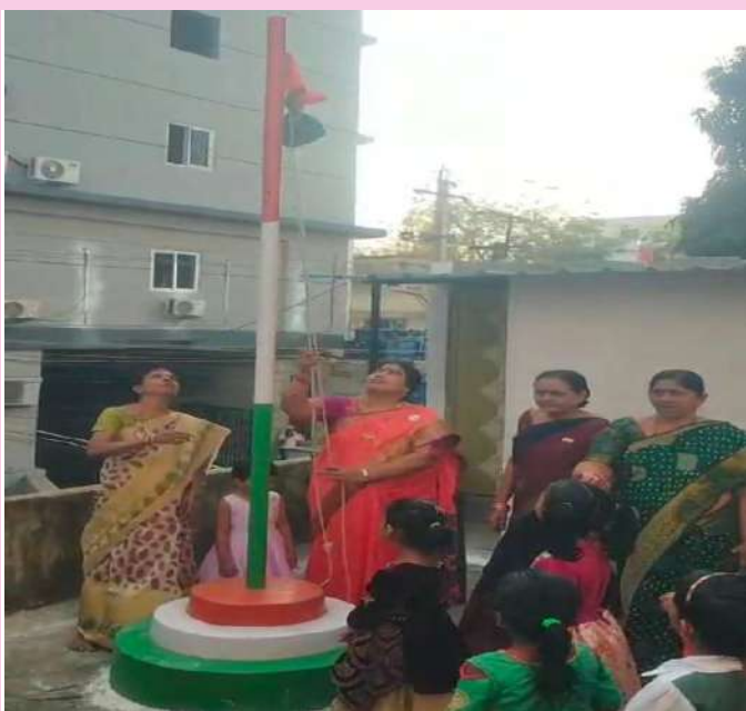
ఖమ్మం ప్రతినిధి ప్రజా జ్యోతి