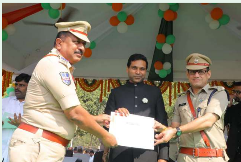
ఖమ్మం ప్రతినిధి ప్రజా జ్యోతి