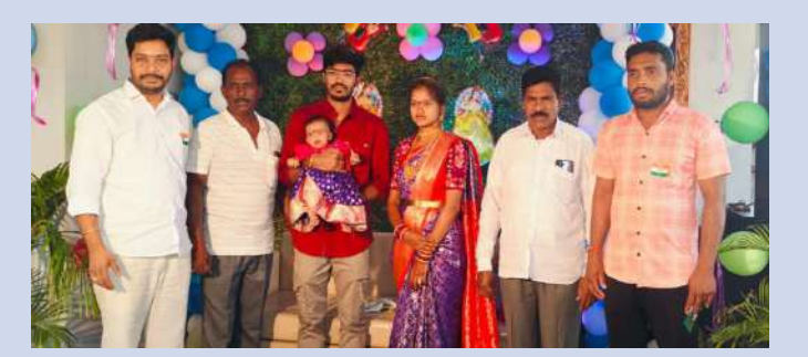
తల్లాడ, జనవరి 26 (ప్రజా జ్యోతి న్యూస్):