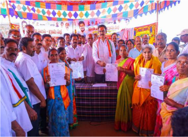
అభిమానులు గ్రామ ప్రజలు తదితరులు పాల్గొన్నారు.