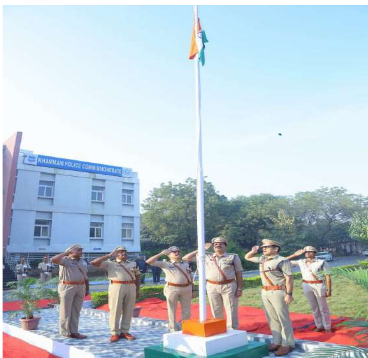
జనవరి 26, ప్రజా జ్యోతి: