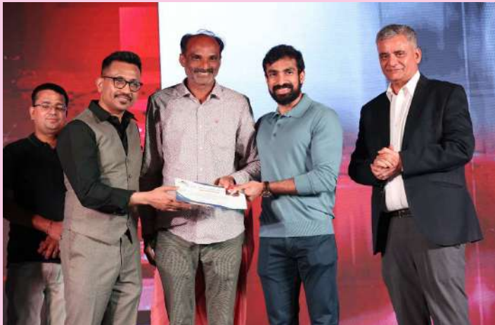
ఖమ్మం ప్రతినిధి ప్రజా జ్యోతి

-5 గ్రాముల గోల్డ్ కాయిన్ ను అందజేసిన సంస్థ వైస్ చైర్మన్, సీఈఓ