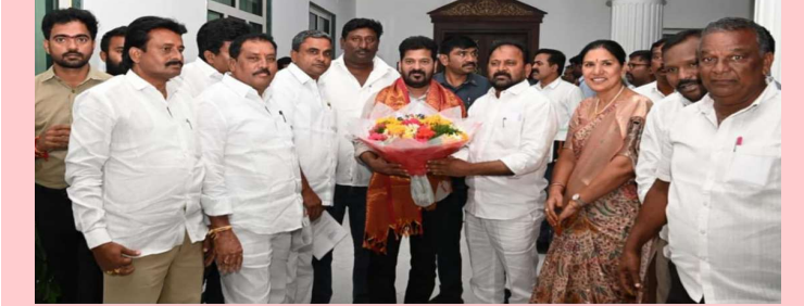
కారేపల్లి, జనవరి 28, ప్రజాజ్యోతి: