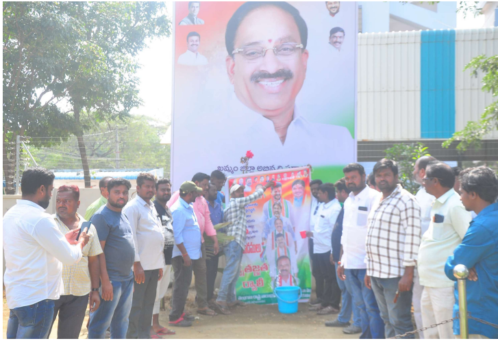
ఖమ్మం ప్రతినిధి ప్రజా జ్యోతి