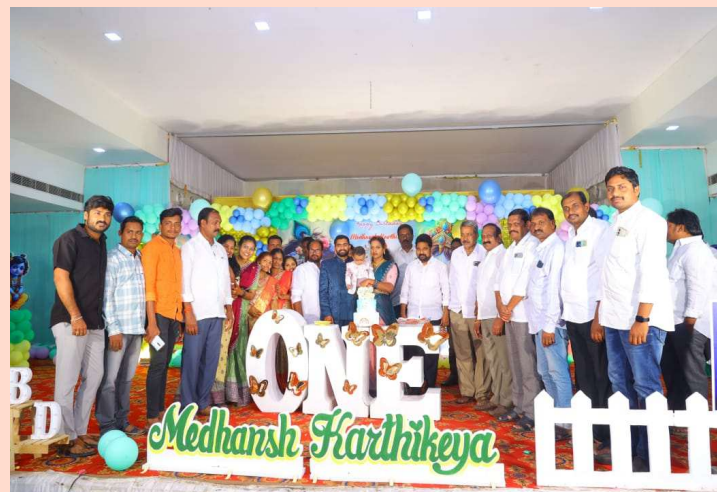
సత్తుపల్లి జనవరి 28 ప్రజా జ్యోతి.