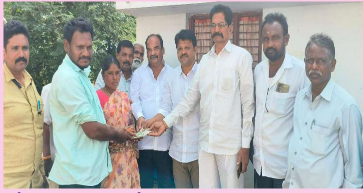
పాలేరు జనవరి 27 ప్రజా జ్యోతి