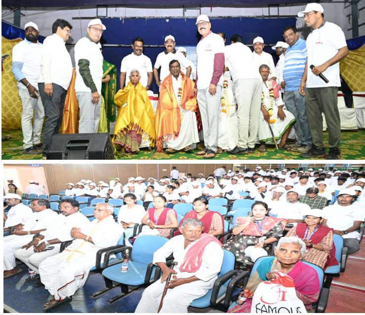
-ప్రజాస్వామ్యంలో ఓటు బలమైన ఆయుధం -పాత కలెక్టరేట్ నుంచి పాత బస్టాండ్ వరకు ఓటర్ చైతన్య ర్యాలీ ఖమ్మం ప్రతినిధి ప్రజా జ్యోతి

జిల్లాలో జాతీయ ఓటర్ దినోత్సవ వేడుకలు ఘనంగా జరిగాయి. శనివారం ఖమ్మం ప్రభుత్వ వైద్య కళాశాల (పాత కలెక్టరేట్) నుంచి పాత బస్టాండ్ వరకు ఓటు ప్రాముఖ్యత వివరిస్తూ ఓటర్ చైతన్య ర్యాలీ విజయవంతంగా జరిగింది. ర్యాలీ ముగింపు సందర్భంగా పాత బస్టాండ్ ఏరియాలో మానవ హారం నిర్వహించి ఓటు హక్కు గొప్పతనాన్ని అధికారులు వివరించారు. అనంతరం శ్రీ భక్త రామదాసు కళాక్షేత్రంలో