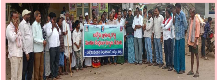
తిరుమలాయపాలెం, జనవరి 25, ప్రజా జ్యోతి :