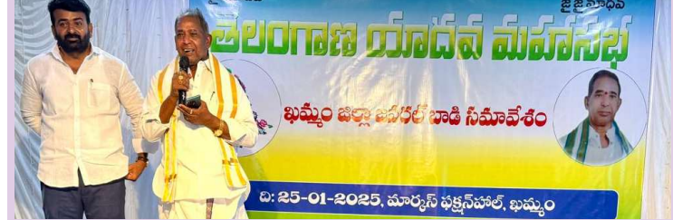
ఖమ్మం ప్రతినిధి ప్రజా జ్యోతి