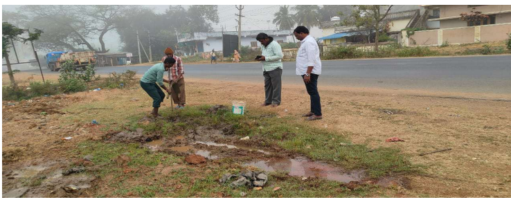
కార్యక్రమంలో గ్రామపంచాయతీ సిబ్బంది తదితరులు పాల్గొన్నారు.