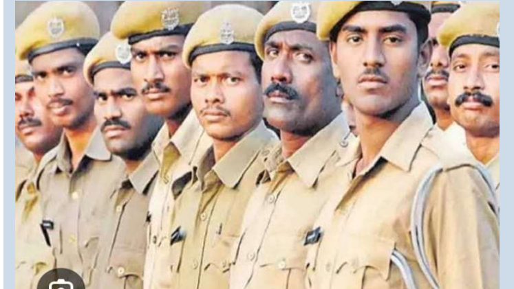
అమరావతి: జనవరి23, ప్రజా జ్యోతి :