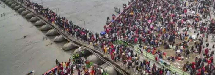
జనవరి23, ప్రజా జ్యోతి :

ప్రపంచంలోనే అతిపెద్ద ఆధ్యాత్మిక వేడుక మహా కుంభమేళాతో ఉత్తరప్రదేశ్లోని ప్రయాగ్ రాజ్ కళకళలాడుతోంది. ఈ కార్యక్రమానికి దేశ విదేశాల నుంచి భక్తులు తరలివస్తున్నారు. పుణ్యస్నానాలు ఆచరిస్తున్నారు. ఇప్పటివరకు త్రివేణి సంగమంలో 10 కోట్లకు పైగా భక్తులు పుణ్యస్నానాలు ఆచరించారని ఉత్తరప్రదేశ్ ప్రభుత్వం ప్రకటించింది. గురువారం మధ్యాహ్నం 12 గంటల వరకు 30 మరో లక్షల మంది పుణ్యస్నానాలు చేసినట్లు తెలిపింది.