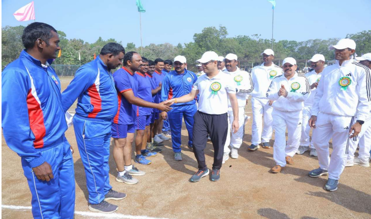
-క్రీడలు ఐక్యతను చాటి చెబుతాయి :పోలీస్ కమిషనర్ ఖమ్మం ప్రతినిధి ప్రజా జ్యోతి