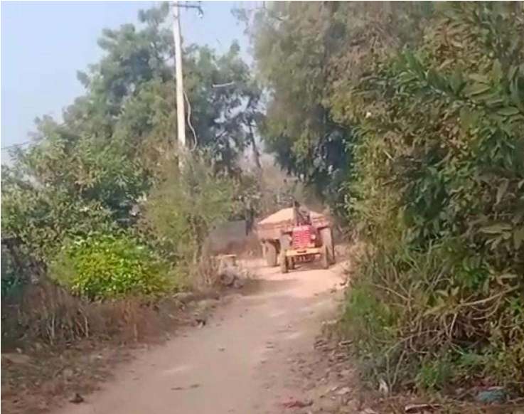
-అన్నానికి బదులుగా ఇసుక బుక్కుతున్న మంత్రి మనుషులు..