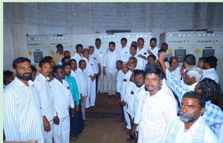
సత్తుపల్లి జనవరి 19 ప్రజా జ్యోతి.

-ఎత్తిపోతల పథకంతో 3700 ఎకరాలకు పంట సీరు.