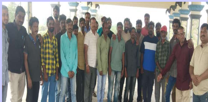
కారేపల్లి, జనవరి 16, ప్రజా జ్యోతి: