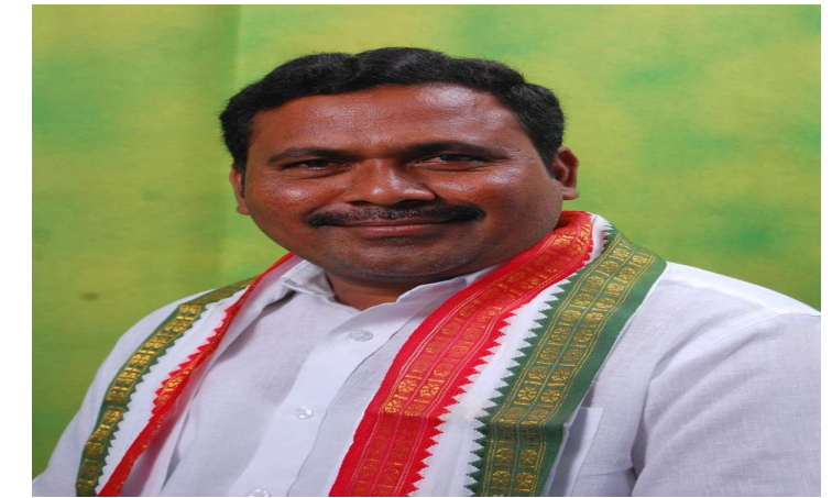
ఆనందం వెల్లివిరియాలని కోరుకుంటూ ఆయన సంక్రాంతి శుభాకాంక్షలను తెలియజేశారు.