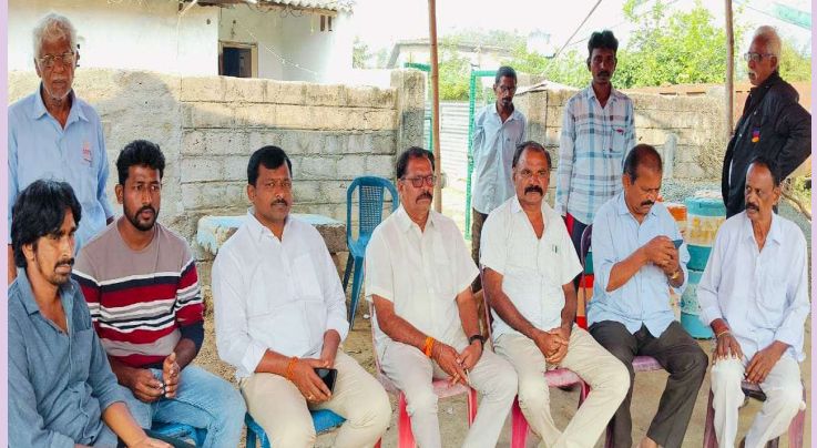
తల్లాడ, జనవరి 6 (ప్రజా జ్యోతి న్యూస్):