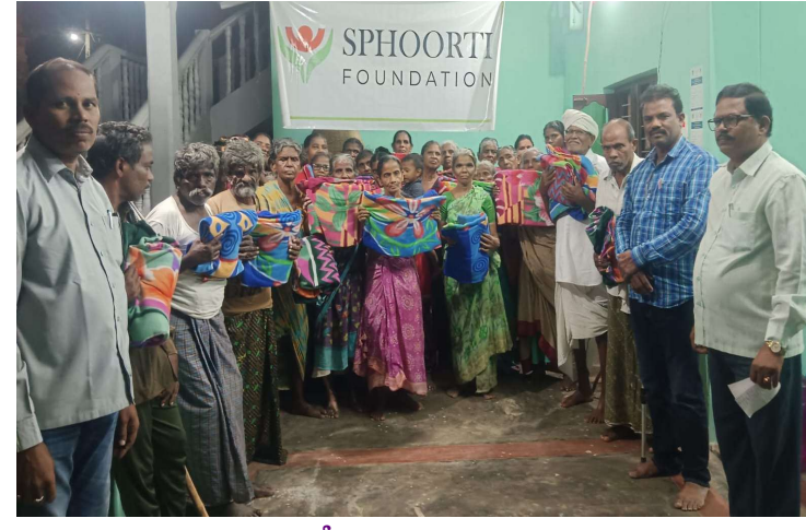
కల్లూరు జనవరి 06(ప్రజా జ్యోతి):