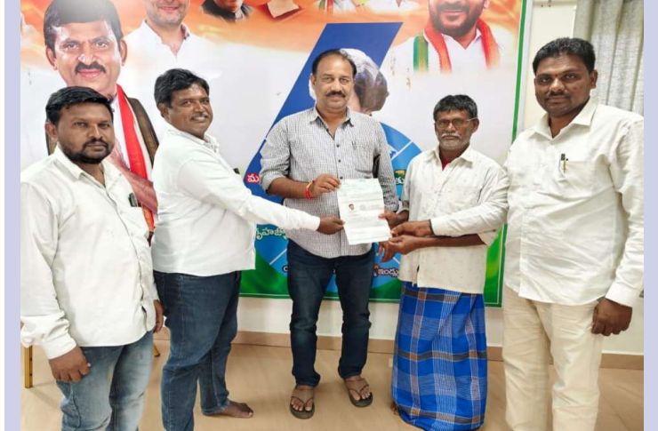
పాలేరు జనవరి 6 ప్రజా జ్యోతి