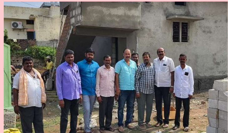
పాలేరు జనవరి 6 ప్రజా జ్యోతి

-నిర్మాణ పనులను పరిశీలించిన కాంగ్రెస్ నాయకులు