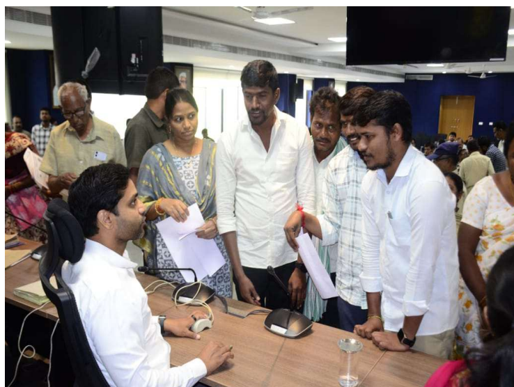
డి.ఆర్.డి.ఓ. సన్యాసయ్య, డి.ఆర్.ఓ. రాజేశ్వరి, కలెక్టరేట్ ఏ.ఓ. అరుణ, జిల్లా అధికారులు, తదితరులు పాల్గొన్నారు.