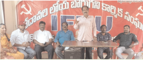
కొత్తగూడెం/జనవరి 8, (ప్రజాజ్యోతి) :

18న కొత్తగూడెంలో ఐఎఫ్ఐయూ విలీన సభను జయప్రదం చేయండి