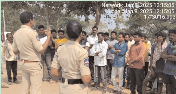
Network: Jan 8, 2025 12:15:05 Local: Jan 8, 2025 12:15:05 17°30'16.993

సందర్భంగా ఆయన మాట్లాడుతూ కోడి పందాలు, పేకాట వంటి అసాంఘిక కార్యకలాపాలకు ఎవరూ పాల్గొన్న ఎటువంటి తారతమ్యం లేకుండా వారిపై కేసు నమోదు చేసి వారి పట్ల కఠినంగా వ్యవహరిస్తామన్నారు. కార్యక్రమంలో ములకలపల్లి పోలీస్ సిబ్బంది, తదితరులు పాల్గొన్నారు.