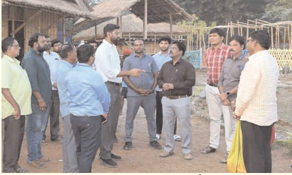
భద్రాచలం, జనవరి 8 (ప్రజా జ్యోతి):

అడవిలో నమ్ముకుని జీవనాన్ని సాగిస్తున్న ఆదివాసుల జీవితాలలో వెలుగులను నింపేందుకు ఆ యువ ఐడిఎస్ అధికారి నడుం బిగించారు. జిల్లా కలెక్టర్ అంటే కిందిస్థాయి అధికారులకు అదేశాలు ఇవ్వడమే కాదు. అవసరమైతే అన్నీ తానే ముందుండి నడిపించడం కూడా అని చాటి చెబుతూ, మారుమూల ప్రాంతాల వైపు ప్రత్యేక దృష్టి సారించి పచ్చని పల్లెలను పర్యాటక ప్రాంతాలుగా తీర్చిదిద్దుతున్నారు. జిల్లాలోని సహజ వనరులను ఉపయోగించుకొని అన్ని రంగాలలో జిల్లాను అగ్రగామిగా నిలిపేందుకు అహర్నిశలు కష్టపడుతున్నారు. ఆయనే భద్రాద్రి కొత్తగూడెం జిల్లా కలెక్టర్ జితేష్ వి పాటిల్. జిల్లా పరిపాలనలో తనదైన ముద్రను వేస్తూ, జిల్లా ప్రజలచే శభాష్ కలెక్టర్ అనిపించుకుంటున్నారు. ముఖ్యంగా దక్షిణ అయోధ్యగా విరాజిల్లుతున్న భద్రాద్రి దివ్య క్షేత్రానికి పర్యాటకులను అమితంగా ఆకట్టుకోవాలని లక్ష్యంతో పలు అభివృద్ధి కార్యక్రమాలకు శ్రీకారం చుట్టి, పర్యాటక రంగాన్ని అభివృద్ధికి విశేష కృషి చేస్తున్నారు.