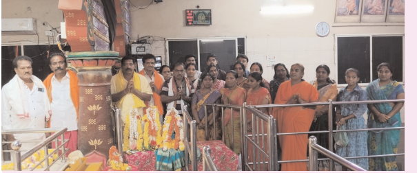
అశ్వారావుపేట, జనవరి 10, ప్రజాజ్యోతి:

తెల్లవారుజామునుంచే స్వామి దర్శనానికి ఆలయాలలో భారులు తీరిన భక్తులు