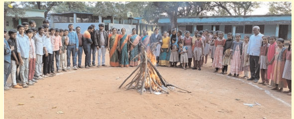
జూలూరుపాడు/జనవరి 10 (ప్రజా జ్యోతి):