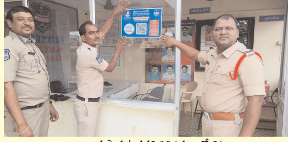
జూలూరుపాడు/జనవరి 10 (ప్రజా జ్యోతి)