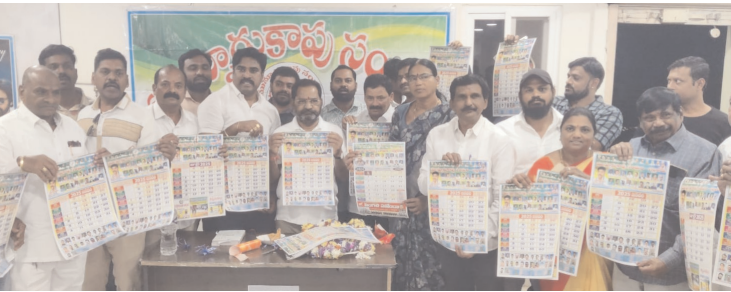
ఇల్లందు/జనవరి 10, (ప్రజాజ్యోతి):