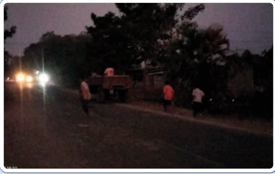
(మొదటి పేజీ తరువాయి...)

మేము తగ్గేదేలే అంటూ హెచ్చరించడం పరిపాటిగా మారింది. భద్రాద్రి కొత్త గూడెం జిల్లా కేంద్రంలోని మున్సిపాలిటీ పరిధిలో బూడిదగడ్డ, పాత కొత్త గూడెం, రామవరం, ప్రాంతాలలో లక్షీ దేవి పల్లె మండలం చాతకొండ, సాటి వారిగూడెం ప్రాంతాలలో ఇలాంటి ఇసుక అక్రమ బకాసురుడు రాజ్యమేలుతున్నారంటే ఈ అక్రమాన్ని అడ్డుకునే నాడుదే లేదని అనిపిస్తుంది. ఇప్పటికే జిల్లా కేంద్రంలో ఉన్న కొద్దిపాటి వాగుల్లో ఇసుకను తోడేస్తూ భూగర్భ జలాలు అడు గంటుతున్న రానున్న వేసవిలో తాగునీటి వివత్తును ఎదుర్కోక తప్పదని ప్రజలు అభిప్రాయపడుతున్నారు. పతికలో వార్షిక ప్రచురితమైన దగ్గర నుంచి అధికారుల హడావుడే తప్ప కార్య చరణ రాపం దాల్చడం లేదని ప్రజలు ఆరో పిస్తున్నారు. ఇప్పటికైనా రెవెన్యూ పోలీస్ శాఖలు దృష్టిసారించి జోరుగా కొన సాగుతున్న ఇసుక అక్రమ రవాణాకు ముక్కుతాడు వేయాలని కోరుతున్నారు.