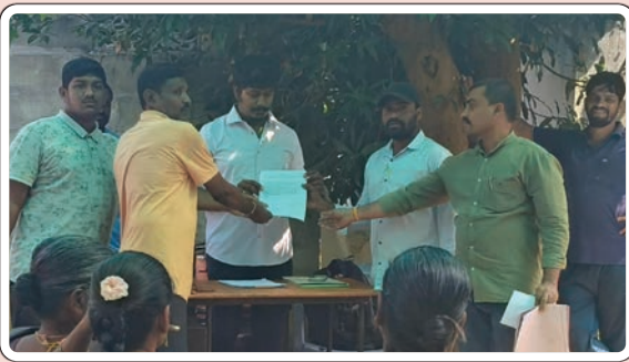
ఇల్లందు / జనవరి 7, (ప్రజాజ్యోతి):