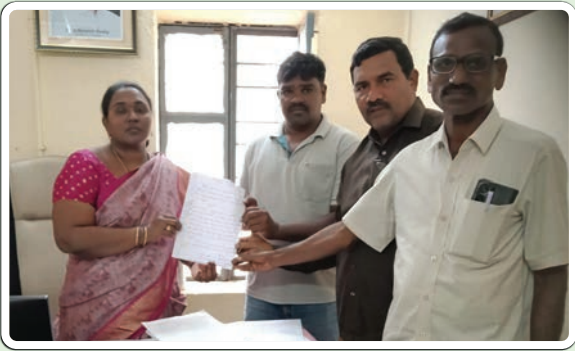
అశ్వాపురం / జనవరి 7, (ప్రజాజ్యోతి):

కబ్బాదారులతో కనుమరుగైన స్మశాన మార్గం స్మశానానికి మార్గం కోసం తహసిల్దార్ కి విసతిపత్రం