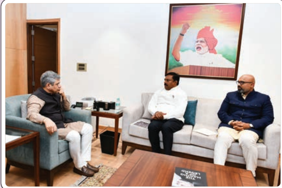
నిర్మల్ అర్చన జనవరి 7 (ప్రజాజ్యోతి)

ఆర్కూర్ - నిర్మల్ - అదిలాబాద్ రైల్వే లైన్ పై చర్చ నిర్మల్ రైల్వే లైన్ పై కేంద్ర మంత్రి తీపి కబురు