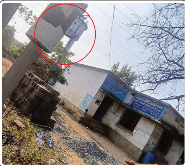
బెల్లంపల్లి, జనవరి 07 (ప్రజాజ్యోతి)