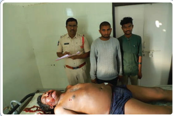
బోధ, జనవరి 7 (ప్రజాజ్యోతి)