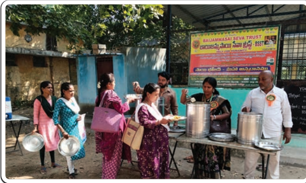
బెల్లంపల్లి, జనవరి 07 (ప్రజాజ్యోతి)

గర్భిణులకు బాలింతలకు దయాలసిస్ పేషెంట్లకు అన్నదానం