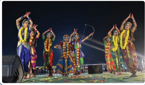
నిర్మల్ అర్చన, జనవరి 07 (ప్రజాజ్యోతి)