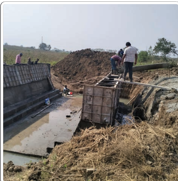
కొమరం భీమ్ జిల్లా ప్రతినిధి జనవరి 07 (ప్రజాజ్యోతి)

ప్రభుత్వ సొమ్మును దోచి పెడుతున్న స్థానిక రాజకీయ నాయకుల బినామీ బిచ్చగాళ్ళు