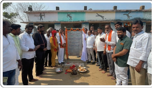
అదిలాబాద్ బ్యూరో జనవరి 7, (ప్రజాజ్యోతి)

పీఎం జనాభా నిధులు, ఆర్థిక 275 నిధుల నుంచి మిసి గురు కులాల భవనాలు, ఆశ్రమ పాఠశాల, డార్మటోరీ, మల్టిపర్పస్ భవన్ నిర్మాణానికి మంగళ