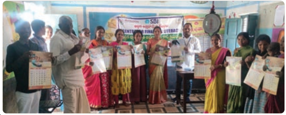
ఇచ్చోడ రూరల్ జనవరి 7, (ప్రజాజ్యోతి)