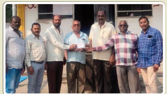
నస్సూర్, జనవరి 7 (తెలంగాణ పత్రిక):