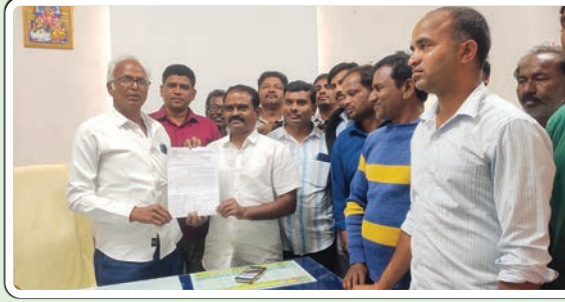
నిర్మల్ టౌన్ డిసెంబర్, 7 (ప్రజాజ్యోతి)