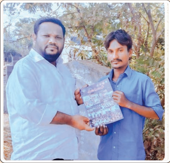
వాంకిడి, జనవరి 07(ప్రజాజ్యోతి)