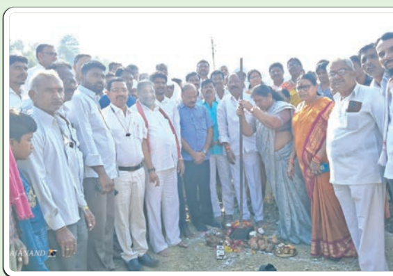
నార్సూర్ జనవరి 07 (ప్రజాజ్యోతి)