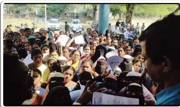
బోధ, జనవరి 7 (ప్రజాజ్యోతి)

బోధ మండల కేంద్రంలోని స్థానిక తహసీల్దార్ కార్యాలయంలో ఎమ్మార్వో కు మంగళవారం బోధ ప్రాంత బీడీ కార్మికులు నూతన పెన్షన్లు ప్రభుత్వం అందించాలని వినతి పత్రం సమర్పించారు. ఈ సందర్భంగా కార్మికులు తెలుపుతూ రాల్చి పగలు తేడా లేకుండా కష్టపడుతూ శ్రమ చేసుకొని బతికే బడుగు జీవులమని తమ పట్ల ప్రభుత్వం ఆలోచన చేసి నూతన పెన్షన్లు అందించాలని కోరారు. అలాగే పది సంవత్సరాలు గడుస్తున్న నేటికీ కొత్త జీవన భృతి అందించలేదని తెలిపారు. ఇక నైనా రాష్ట్ర ప్రభుత్వం తమ గోడు గోసను ఆలకించి జీవన భృతి వీలైనంత తొందరలో ప్రకటించాలని కార్మికులు ప్రధానంగా డిమాండ్ చేశారు. ముఖ్యంగా ప్రజా ప్రభుత్వం తమపై దయ చూపి జీవన భృతి అందించి పుణ్యం కట్టుకోవాలని తెలియజేశారు. అంతేకాకుండా నాలుగువేల పెన్షన్స్ అందించి ఆశీర్వాదాలు అందుకోవాలని ప్రభుత్వానికి మొర పెట్టుకున్నారు. ఈ కార్యక్రమంలో బీడీ కార్మికులు తదితరులు పాల్గొన్నారు.