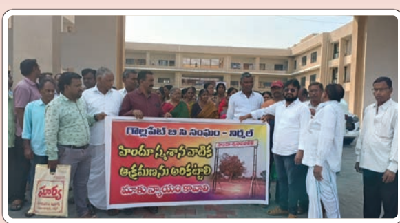
నిర్మల్ టౌన్ డిసెంబర్, 7 (ప్రజాజ్యోతి)

నిర్మల్ జిల్లా కేంద్రంలోని గొల్లపేట్ కాలనీలో బీసీ స్వ శాసన వాటికను కబ్జా చేస్తున్న వ్యక్తిపై చట్టపరమైన చర్యలు తీసుకోవాలని జిల్లా ఎస్సీ కార్యాలయంలో అదనపు ఎస్సీకి మంగళవారం రోజున వినతిపత్రం అందజేశారు. ఎన్నో ఏళ్లుగా కాలనీలో స్వ శాసన వాటిక ఉందని కానీ అన్య మతస్తుడు దొంగ పట్టాలు సృష్టించి స్వ శాసన వాటికను ఆక్రమించే ప్రయత్నం చేస్తున్నారని, వెంటనే కబ్జాకు ప్రయత్నిస్తున్న వ్యక్తిని అరెస్టు చేయాలని డిమాండ్ చేశారు.