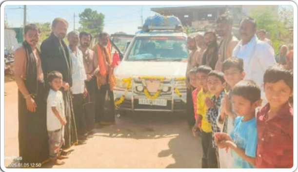
సిరికొండ జనవరి 5 (ప్రజాజ్యోతి)