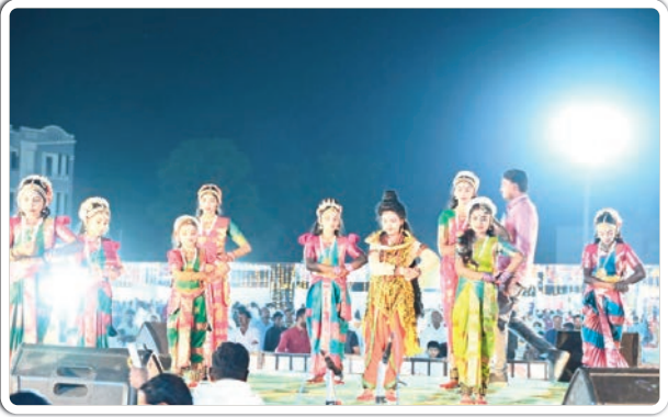
నిర్మల్ అర్బన్ జనవరి 05 (ప్రజాజ్యోతి)