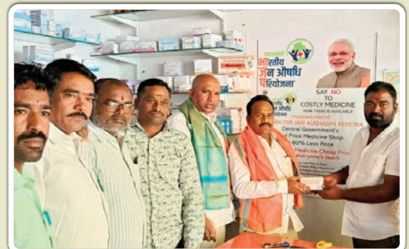
జన్నారం జనవరి 5