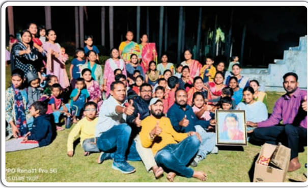
బెల్లంపల్లి, జనవరి 05 (ప్రజాజ్యోతి)