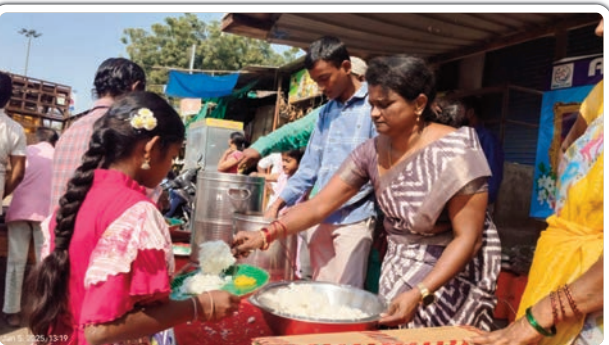
బెల్లంపల్లి, జనవరి 06 (ప్రజాజ్యోతి)