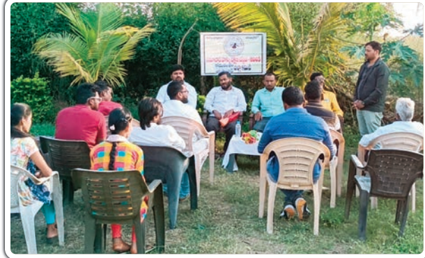
కామ్రజ్ నగర్ రూరల్, ప్రజాజ్యోతి స్టూన్