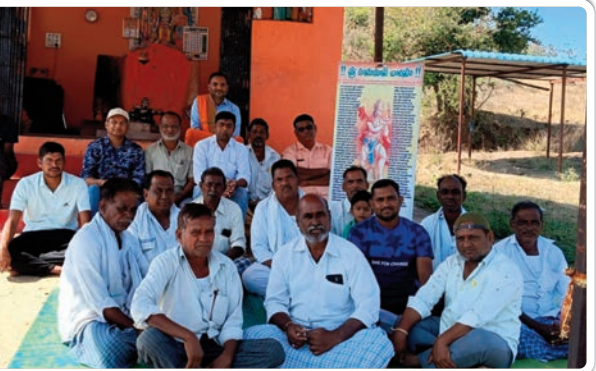
బోఫ్, జనవరి 5 (ప్రజాజ్యోతి)

బోఫ్ మండల కేంద్రానికి సమీపంలోని పెద్దర్ర గుట్ట ఆంజనేయ స్వామి ఆలయ అభివృద్ధి కి అందరం కలిసి పని చేయాలని ఆలయ కమిటీ ఆదివారం ఏకగ్రీవ తీర్మానాన్ని ఆమోదించింది. ఈ మేరకు ఆలయ ప్రాంగణంలో సభ్యులు సమావేశం అయ్యారు. అలాగే ఆలయ ప్రాంగణంలో నవగ్రహ మండపం నిర్మాణం తో పాటుగా ఆంజనేయ స్వామి విగ్రహ ఏర్పాటుకు సభ్యులు నిర్ణయం తీసుకున్నట్లు తెలిపారు. ముఖ్యంగా ఆలయ ప్రాంగణాన్ని మరింత సర్వాంగ సుందరంగా తీర్చిదిద్దేందుకు గ్రవేల్ పోయంచడంతో పాటు లెవలింగ్ పనులపై సభ్యులు పలు సూచనలు చేశారు. ఈ కార్యక్రమంలో కమిటీ సభ్యులు, భక్తులు పాల్గొన్నారు.