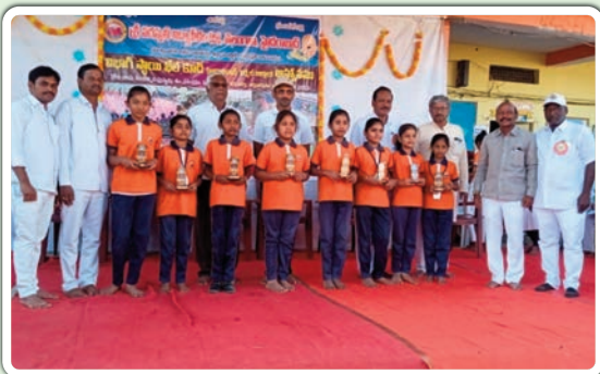
బజార్ హత్వూర్ ప్రజాజ్యోతి 5 జనవరి

జిల్లా స్థాయి క్రీడ పోటీలో విద్యార్థుల ప్రతిభ బజార్ హత్వూర్ శ్రీ సరస్వతి శిశు మందిర్ పాఠశాల విద్యార్థులు గెలుపొందిన విద్యార్థిని విద్యార్థుల ఉత్సాహం