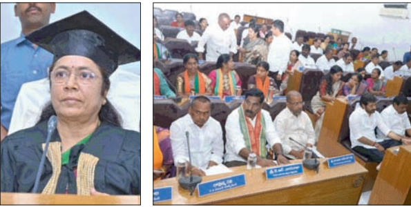
- మేయర్ అధ్యక్షతన జరిగిన సమావేశం