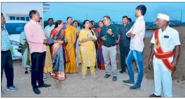
- జిల్లా కలెక్టర్ డా. సత్య శారద