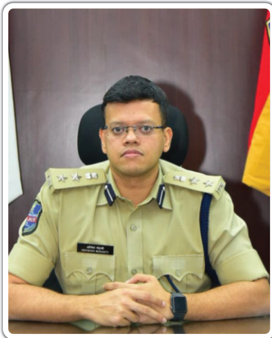
ద్రోణ వినియోగంపై నిషేధాజ్ఞలు

కమీషనరేట్ పరిధిలో శాంతిభద్రతలకు విఘాతం కలిగించే వారిపై చట్టపరమైన చర్యలు తీసుకుంటూ మని కరీంనగర్ పోలీస్ కమీషనర్ అభిషేక్ మొహంతి గురువారం ఒక ప్రకటనలో తెలిపారు. శాంతిభద్రతల పరిరక్షణ చర్యల దృష్ట్యా నియమనిబంధనల అమలు చేస్తున్నామని పేర్కొన్నారు. సంబంధిత ఏసీపీ ల నుంచి అనుమతి లేకుండా సభలు, సమావేశాలు, ఊరేగింపులను నిర్వహించకూడదని తెలిపారు. అనుమతులు లేకుండా ఎటువంటి సభలు సమావేశాలు, ర్యాలీలు నిర్వహించకూడదని సంబంధిత అధికారుల నుండి అనుమతులు తప్పనిసరి అని తెలిపారు. అనుమతుల కోసం దరఖాస్తు చేయడం ద్వారా ఎటువంటి అవాంఛనీయ సంఘటనలు జరగకుండా అట్టి కార్యక్రమానికి తగిన విధంగా పోలీసు శాఖ భద్రతాపరమైన చర్యలు చేపడుతుంది అన్నారు. ఈ ఉత్తర్వులు ఈనెల 31 వరకు అమల్లో ఉంటాయని తెలిపారు.