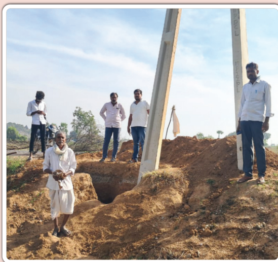
చిగురుమామిడి జనవరి 2: (ప్రజాజ్యోతి)

పంట చేసు ఎండిపోయిన స్పందించలేదని రైతు ఆవేదన..