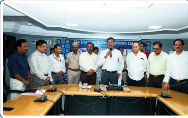
మిగతా 2 లో... ▶

సింగరేణిలో పని చేస్తున్న ప్రతీ ఒక్క ఉద్యోగిని సమాజంలో మంచిగా రవం, గుర్తింపు లభిస్తున్నాయని.. మనల్ని ఉన్నత స్థాయిలో నిలబెడుతున్న సంస్థ భవిష్యత్ ప్రతీ ఒక్కరికీ ప్రథమ ప్రాధాన్యం కావాలని సీఎంఓ ఎన్.బలరామ్ అన్నారు. సింగరేణి ఉజ్వల భవిష్యత్ కోసం ప్రతీ ఒక్కరూ తమకు కేటాయించిన 8 గంటల పాటు అంకితభావంతో పనిచేయాలన్నారు. నూతన సంవత్సరం