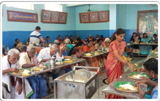
భద్రాచలం టౌన్, జనవరి 02 (ప్రజాజ్యోతి)