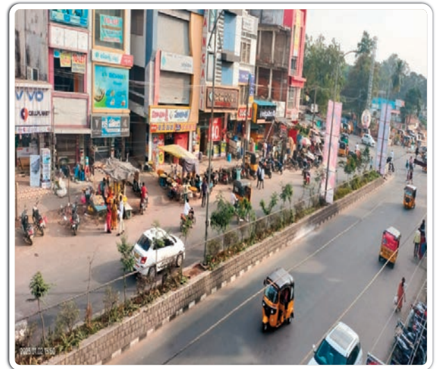
మిగతా 2 లో... ▶

భద్రాద్రి కొత్తగూడెం జిల్లాగా ఆవిర్భావం జరిగిన తరువాత జాతీయ రహదారుల పేరుతో మార్గం సుగమం చేసేందుకు రోడ్డు మధ్యలో అక్కడక్కడ ఏర్పాటు చేసిన డివైడర్లు ప్రజలకు అనేక ఇబ్బందులు పెడుతున్నాయి. భద్రాద్రి జిల్లాలో ప్రధానంగా బస్టాండ్ సెంటర్ నుంచి పాత డివైడర్ల వరకు జాతీయ రహదారి మధ్యలో నాలుగు అడుగుల ఎత్తులో ఏర్పాటు చేసిన డివైడర్లు ప్రజల రాకపోకలకు అనేక అటంకాలు కలుగుతున్నాయి. రైల్వే స్టేషన్ దగ్గర నుంచి పాత డివైడర్ల వరకు డివైడర్ల మధ్యలో దారి ఇవ్వక పోవడంతో వాహనదారులు ప్రజలు దూరంగా ఉన్న డివైడర్లు దాటి రావల్సింది. జిల్లా కేంద్రం కావడంతో వ్యాపార సముదాయాలు పెరగడంతో అదే తరహాలో సూపర్ బజార్ సెంటర్లో నిత్యం ప్రజలతో రద్దీ ఏర్పడుతుంది. అక్కడక్కడ అవసరం లేని చోట దారి సౌకర్యం కల్పించిన అధికారులు రోడ్డు అటువైపు నుంచి ఇటువైపు వెళ్లేందుకు అత్యవసర మార్గాన్ని ఏర్పాటు చేయాలి అధికారులు అవసరం లేని చోట కల్పించడం పట్ల