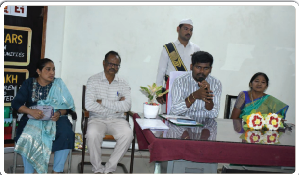
భద్రాచలం, జనవరి 2