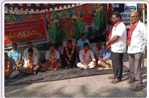
భద్రాచలం టౌన్, జనవరి 2 (ప్రజాజ్యోతి)