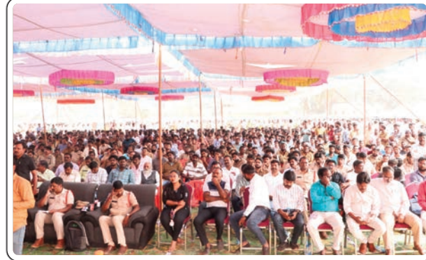
రంతో కూడిన స్పెక్టర్లను కచ్చితంగా అమర్చుకోవాలని స్పష్టం చేశారు. పోలీస్ కళాబృందం, జిల్లా పౌరసంబంధాల శాఖ కళాకారుల చేత ట్రాఫిక్

ఉద్దేశించి మాట్లాడుతూ ఆటోలు నడుపుకుంటూ జీవనం సాగించే ప్రతి ఒక్కరూ ప్రభుత్వ ఇన్సూరెన్స్ పథకాలను ఉపయోగించుకోవాలని, పోలీసు వారు సూచించిన నియమాలను పాటించి, బాధ్యతగా వ్యవహరించాలని కోరారు. అసాంఘిక కార్యకలాపాలకు పాల్పడే వ్యక్తులు ఎవరైనా అనుమానాస్పదంగా కనిపిస్తే పోలీసు వారికి సమాచారం అందించాలని అన్నారు. జిల్లా వ్యాప్తంగా ఎనిమిది వేల ఆటోలకు పోలీస్ శాఖ తరఫున స్పెక్టర్లను ఈ సందర్భంగా ఎస్సీ ఆవిష్కరించారు. ఆటో డ్రైవర్ల తమ సమాచారం