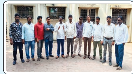
కొత్తగూడెం జనవరి 29 ప్రజా జ్యోతి: