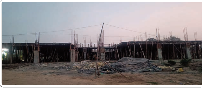
భద్రాచలం, జనవరి 29 ప్రజాజ్యోతి :

భద్రాచలం శ్రీ సీతారామచంద్ర స్వామి వారి దేవస్థాన ఆలయ అభివృద్ధి నిమిత్తం కేంద్ర ప్రభుత్వ పర్యాటక శాఖ ఆధ్వర్యంలో ప్రసాద్ పథకం (తీర్థయాత్రల పునర్నివసం, ఆధ్యాత్మిక వారసత్వ వృద్ధి పథకం) కింద సుమారు రూ. 60 కోట్లు కేటాయించిన విషయం విధితమే. సాక్షాత్తు రాష్ట్రపతి చేతుల మీదుగా సదరు పనులకు శంకుస్థాపన కార్యక్రమాన్ని నిర్వహించి రెండేళ్లు పూర్తిచేస్తున్న పనులు మాత్రం సగం కూడా పూర్తి కాకపోవడం విశేషం. ఇదిలా ఉండగా ఏడాదిలో పూర్తి చేయాల్సిన పనులను రెండేళ్లుగా సాగదీస్తున్న సంబంధిత శాఖ అధికారులతో పాటు భద్రాద్రి రామాలయ అధికారులు సైతం ప్రేక్షక పాత్ర వహిస్తుండడంతో రామభక్తులు ఆందోళన చెందుతున్నారు. ఆఖరికి మిథిలా స్టేడియంలో ప్రతి ఏడాది శ్రీరామనవమి సందర్భంగా జరిగే సీతారాముల కల్యాణాన్ని వీక్షించే భక్తుల సౌకర్యార్థం శాశ్వత ప్రాతిపదికన నిర్మించే షెడ్యూల్ పనులు సైతం పిల్లర్ల దశలోనే ఆగిపోవడంతో ఏడాది నవమి నాటికి మిథిలా స్టేడియంలో శాశ్వత షెడ్యూల్ కష్టమే అంటూ రామ భక్తులు నిరాశ చెందుతున్నారు. వాస్తవానికి ప్రసాద్ పథకం కింద మంజూరైన నిధులతో భద్రాచలం, పర్వతాల ఆలయాలలో అభివృద్ధి పనులు చేపట్టాల్సి ఉంది. ఇందులో రూ.22 కోట్లతో సివిల్ పనులు చేపడుతున్నామని పర్యాటక శాఖ ఇంజనీరింగ్ అధికారులు గతంలోనే తెలియజేశారు. అంతే కాక మౌలిక వసతులు, డిజిటల్ ప్రొజెక్ట్ల రూము కోసం రూ.8.94 కోట్లతో గ్రౌండ్-1 భవనం నిర్మాణం చేపట్టాల్సి ఉంది. అలాగే ప్రత మండపం,