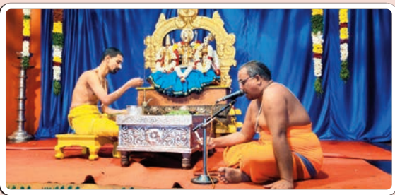
భద్రాచలం, జనవరి 29 ప్రజాజ్యోతి :

శ్రీ సీతారామచంద్రస్వామి ఆలయంలో సీతారాముల నిత్యకల్యాణం బుధవారం వైభవంగా నిర్వహించారు. తెల్లవారుజామున స్వామివారికి సుప్రభాతం పలికి, ఆరాధన, ఆరగింపు, సేవాకాలం, నిత్యహోమాలు, నిత్యబలిహారణం తదితర పూజలను భక్తిశ్రద్ధలతో నిర్వహించారు. నిత్యకల్యాణంలో పాల్గొన్న జంటలకు స్వామివారి ప్రసాదాలు, శేషపస్తాలు అందజేశారు.