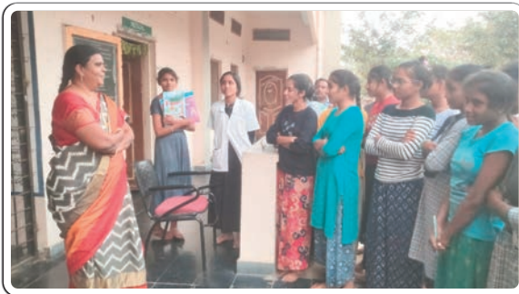
బేకులపల్లి, జనవరి 29, ప్రజాజ్యోతి :