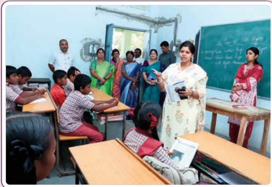
నల్గొండ, ప్రజాజ్యోతి ప్రతినిధి: