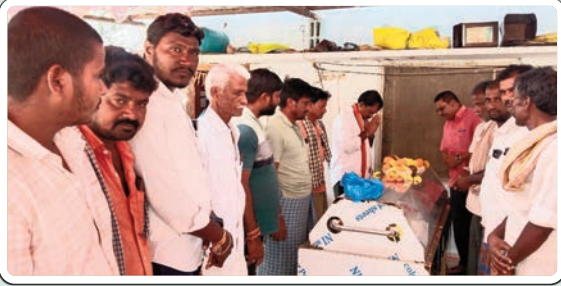
రామన్నపేట, జనవరి 28 (ప్రజా జ్యోతి)