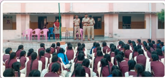
అడ్లగూడూర్ జనవరి 28 (ప్రజా జ్యోతి)