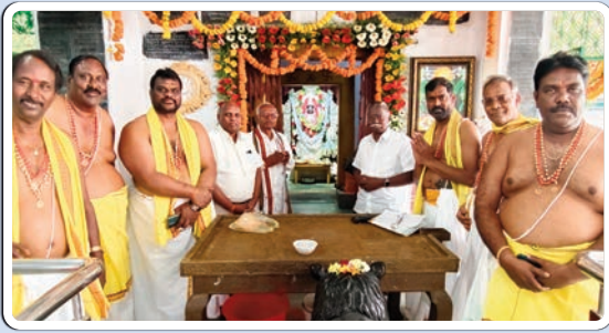
సూర్యాపేట జిల్లా ప్రతినిధి జనవరి 28(ప్రజాజ్యోతి):