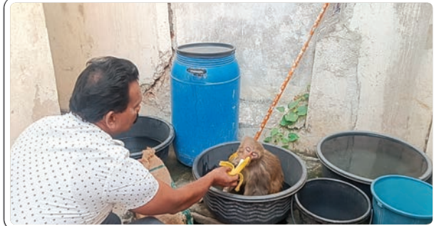
కోదాడ రూరల్ జనవరి 28 (ప్రజాజ్యోతి)