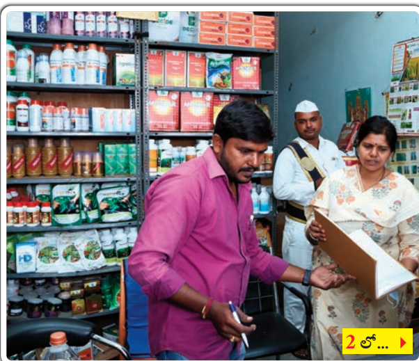
2 లో... >