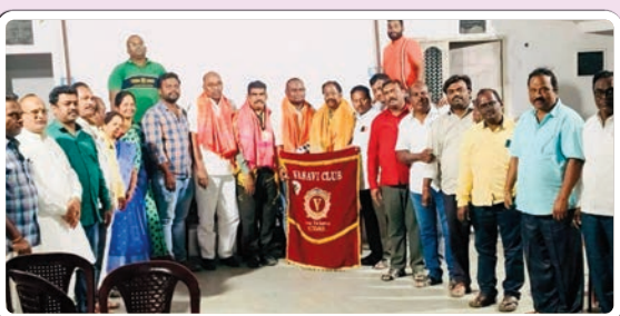
కోదాడ రూరల్ జనవరి 28 (ప్రజాజ్యోతి)