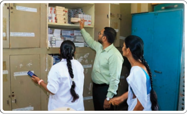
సూర్యాపేట జిల్లా ప్రతినిధి జనవరి 28(ప్రజాజ్యోతి):