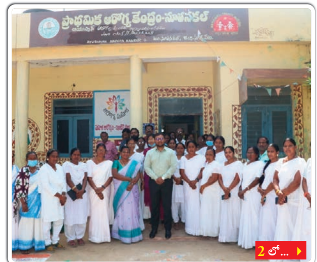
2 లో... >