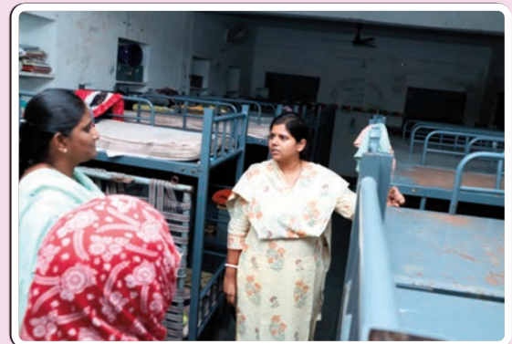
నల్గొండ, ప్రజాజ్యోతి ప్రతినిధి: