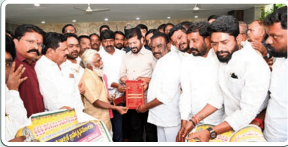
నార్కట్ పల్లి జనవరి 28 (ప్రజా జ్యోతి)