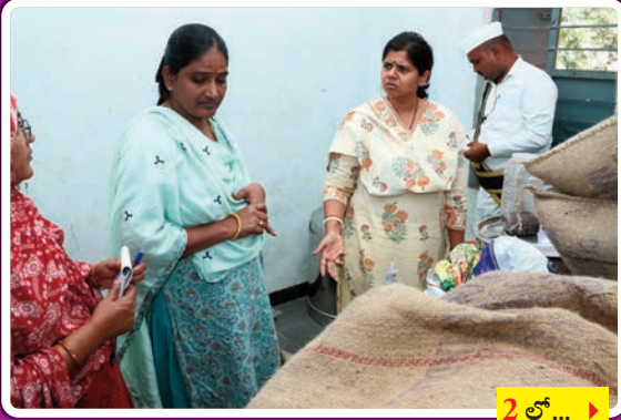
2 లో... >

నిర్వహణ సరిగా లేకపోవడంపై స్టోర్ ఇన్చార్జ్, వార్డెన్ పై ఆగ్రహం