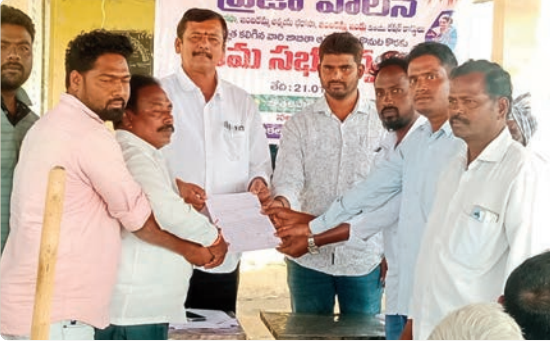
దామరచర్ల, జనవరి 21, (ప్రజా జ్యోతి):

పలు గ్రామాలలో భూమి ఉన్న వారికి రేషన్ కార్డు, ఆత్మీయ భరోసా పై సర్వత్ర విమర్శలు