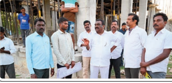
తుంగతుర్తి, జనవరి 21, (ప్రజా జ్యోతి):

ఆసుపత్రి నిర్మాణ పనులను పరిశీలించిన ఎమ్మెల్యే మండుల