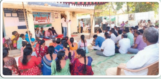
చౌటుప్పల్ జనవరి 21 (ప్రజా జ్యోతి)

- గ్రామ పంచాయతీలకు భారులు తిరిగి దరఖాస్తుదారులు