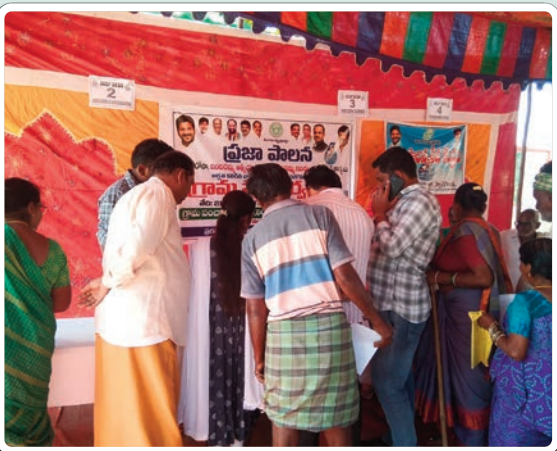
నార్కట్ పల్లి జనవరి 21 (ప్రజాజ్యోతి):