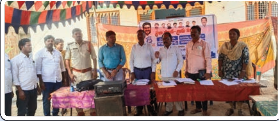
నాగారం జనవరి 21 ప్రజా జ్యోతి.