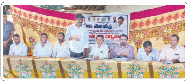
నకిరేకల్, జనవరి 21 (ప్రజాజ్యోతి)

అర్జులైన పేదలందరికీ సంక్షేమ పథకాలు అందిస్తామని నకిరేకల్ ఎమ్మెల్యే వేముల వీరేశం అన్నారు. మంగళవారం నకిరేకల్ మండలంలోని నడిగూడెం, ఓగోడ్, నోముల గ్రామాల్లో ప్రభుత్వం ప్రవేశపెట్టిన సంక్షేమ పథకాలు అమలు కోసం గ్రామ సభ నిర్వహించారు ఈ సందర్భంగా ఆయన మాట్లాడారు. రైతు భరోసా, ఇందిరమ్మ అత్యయ భరోసా, ఇందిరమ్మ ఇండ్లు, రేషన్ కార్డులు అర్హత కలిగిన వారందరూ దరఖాస్తు చేసుకోవాలని ఆయన కోరారు. గ్రామసభలో ఆమోదించి అర్హత కలిగిన అందరికీ సంక్షేమ పథకాలు అందిస్తామని తెలిపారు ఈ కార్యక్రమంలో మండల అధికారులు స్థానిక నాయకులు పాల్గొన్నారు.