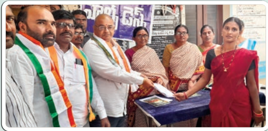
అనంతగిరి జనవరి 21 (ప్రజా జ్యోతి)