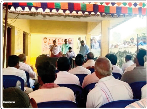
నడిగూడెం, జనవరి 21, ప్రజాజ్యోతి: