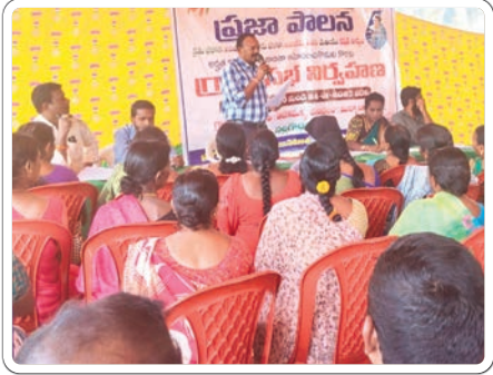
మిర్యాలగూడ, జనవరి 21, (ప్రజా జ్యోతి):