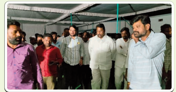
ధర్మపురి (జనవరి 21) ప్రజాజ్యోతి: