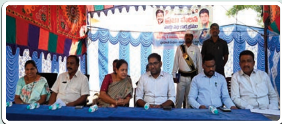
రామగిరి, జనవరి 21 (ప్రజాజ్యోతి):

- మంధని మున్సిపల్ కార్యాలయంలో నిర్వహించిన వార్డు సభలో పాల్గొన్న జిల్లా కలెక్టర్