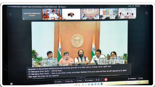
(మొదటి పేజీ తరువాయి...)

అనర్జులగా తేలితే జాబితా నుంచి తొలగించాలని ఉప ముఖ్యమంత్రి అధికారులను ఆదేశించారు. గ్రామ సభలలో పెట్టే ప్రాథమిక జాబితా మంజూరు పత్రం కాదని, కేవలం దరఖాస్తుల స్వీకరణ జాబితా మాత్రమేనని ప్రజలకు తెలియజేయాలని, అర్జుల ఎవరైనా ఉంటే దరఖాస్తులు తీసుకుంటామని విచారించి అర్జులకు తప్పనిసరిగా పథకాలు అందిస్తామని ప్రజలకు స్పష్టంగా అధికారులు తెలుపాలని ఉప ముఖ్యమంత్రి అన్నారు. ప్రభుత్వం అమలు చేసే ప్రజా సంక్షేమ కార్యక్రమాల లబ్ధి పొందాలంటే ప్రజలు ఎప్పుడైనా మందలాలు, మున్సిపాలిటీలలో ఏర్పాటు చేసిన ప్రజా పాలన కేంద్రాలలో దరఖాస్తులు సమర్పించ వచ్చని అన్నారు. ప్రజాపాలన కేంద్రాలకు వచ్చే దరఖాస్తులను ఎప్పటికప్పుడు పరిశీలిస్తూ అర్జులను ఎంపిక చేసి పథకాలను వర్తింప చేయడం జరుగుతుందని అన్నారు. రాష్ట్రనీటి పారుదల, పౌర సరఫరాల శాఖ మంత్రి ఉత్తమ్ కుమార్ రెడ్డి మాట్లాడుతూ, మన రాష్ట్రంలో 91 లక్షల తెల్ల రేషన్ కార్డులు 2 కోట్ల 80 లక్షల లబ్ధిదారులతో ఉన్నాయని, గత 10 సంవత్సరాలలో నూతన రేషన్ కార్డులు జారీ చేయని కారణంగా ప్రస్తుతం ప్రజల నుంచి అధికంగా డిమాండ్ ఉందని