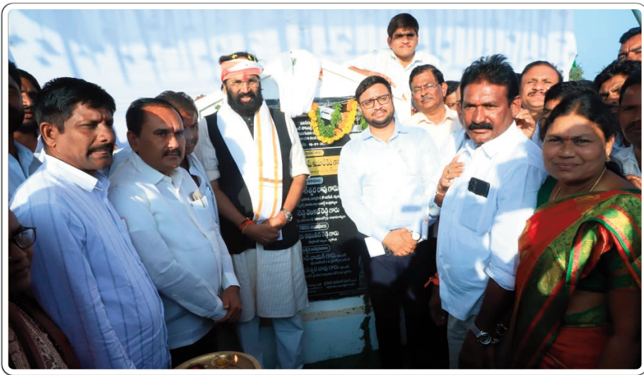
నాలుగు పథకాలు ఈ నెల 21 నుండి 24 వరకు నిర్వహించే గ్రామ సభలు నిర్వహిస్తామన్నారు. రేషన్ కార్డులు, ఇందిరమ్మ ఇల్లు, ఇందిరమ్మ అత్యీయ భరోసా, రైతు భరోసా, పథకాలకు క్షేత్రస్థాయిలో అధికారులు సర్వే నిర్వహించారని లబ్ధిదారుల పేర్లను జాబితాను జనవరి 21 నుంచి 24 తారీకు వరకు జరిగే గ్రామసభలలో ప్రదర్శిస్తారని జాబితాలో తమ