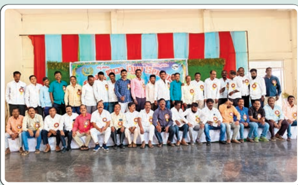
ఆలేరు, జనవరి 19 (ప్రజాజ్యోతి):

ఆలేరు పట్టణంలోని జిల్లా పరిషత్ ఉన్నత పాఠశాల ఆలేరు 1989-90 సంవత్సరం బ్యాచ్ పదవ తరగతి చదివిన పూర్వ విద్యార్థుల ఆత్మీయ సమ్మేళనం ఆదివారం ఆలేరు పట్టణంలోని ఇమ్మిడి నరసింహారెడ్డి ఫంక్షన్ హాల్ లో ఘనంగా జరిగింది. ఇక్కడ విద్యనభ్యసించిన పూర్వ విద్యార్థులు వివిధ స్థాయిలో ఉన్నవారు అందరూ హాజరయ్యారు. 35 ఏళ్ల తర్వాత ఒకచోట కలుసుకొని ఒకరికొకరు యోగక్షేమాలు తెలుసుకొని చిన్ననాటి జ్ఞాపకాలు నెమరు వేసుకున్నారు. చదివిన బడి పరిసరాలను చూసి భావోద్వేగానికి గురయ్యారు. తమకు విద్యను బోధించిన సందర్భంగా పలువురు పూర్వ విద్యార్థులు మాట్లాడుతూ నాటి గురువులు నేర్పిన క్రమశిక్షణ చదువుతో ఈరోజు వివిధ స్థాయిలో ఉన్నామని తెలిపారు. మాకు విద్యను నేర్పిన గురువులకు ప్రత్యేక ధన్యవాదాలు తెలిపారు. ఈ కార్యక్రమంలో ఉపాధ్యాయులు పూర్వ విద్యార్థులు అందరూ పాల్గొన్నారు.