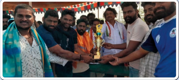
మిర్యాలగూడ, జనవరి 19, (ప్రజాజ్యోతి):