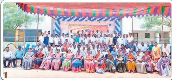
జమ్మికుంట, జనవరి 19, (ప్రజాజ్యోతి):

37వేళ్ళ తరువాత ఒకే వేదికపై విద్యార్థులు, ఉపాధ్యాయులు