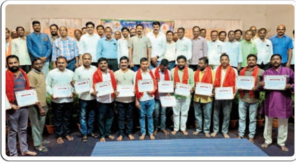
జగిత్యాల రూరల్, జనవరి 19, (ప్రజాజ్యోతి)