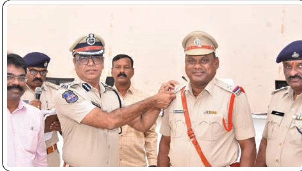
బెల్లంపల్లి, డిసెంబర్ 31 (ప్రజాజ్యోతి)