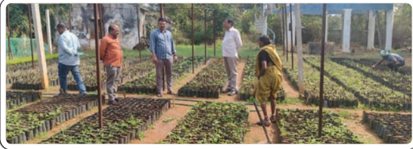
బెల్లంపల్లి, డిసెంబర్ 31 (ప్రజాజ్యోతి)