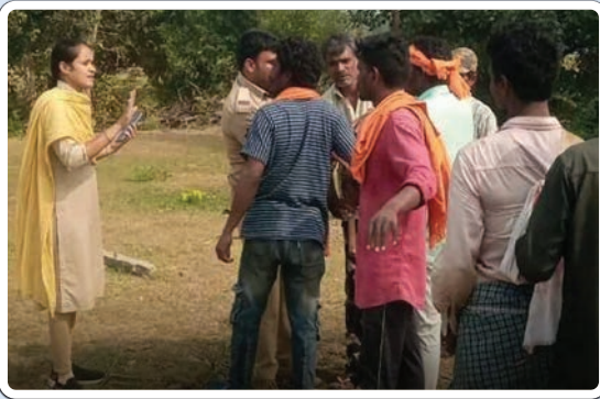
జన్నారం, డిసెంబర్ 31, (ప్రజాజ్యోతి)