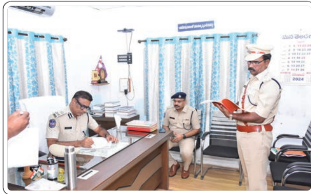
బెల్లంపల్లి, డిసెంబర్ 31 (ప్రజాజ్యోతి)