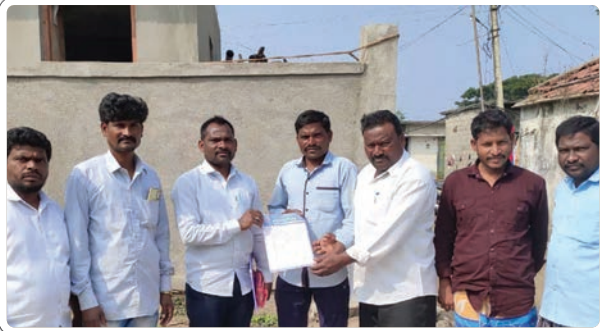
బోధ్, డిసెంబర్ 31