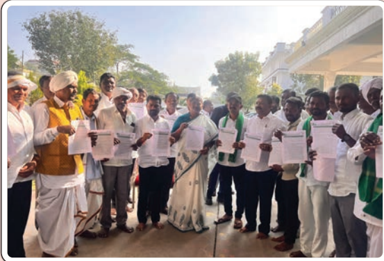
ఆదిలాబాద్ బ్యూరో డిసెంబర్ 31, (ప్రజాజ్యోతి)

రాష్ట్ర పంచాయతీ రాజ్, శిశు సంక్షేమ శాఖ మంత్రి సీతక్క