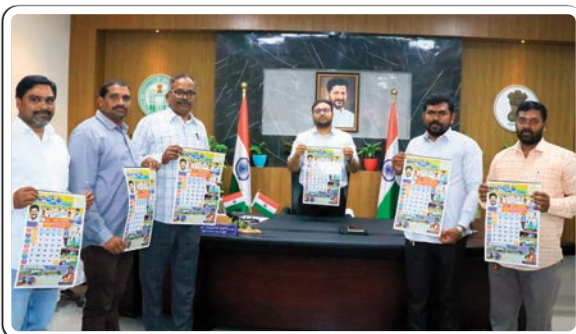
శారు. తదనంతరం కలెక్టర్ మాట్లాడుతూ ప్రజలకు ప్రభుత్వానికి మధ్య వారధిగా పత్రికలు పనిచేయాలని ఈ సందర్భంగా సూచించారు. ప్రజల సమస్య