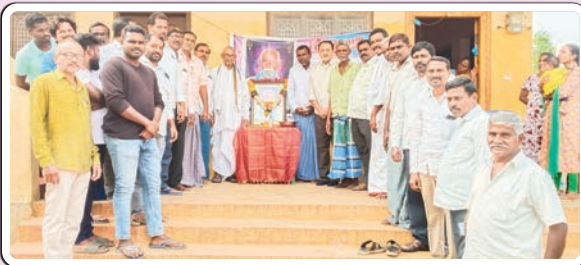
పెన్ పహాడ్ జనవరి 17 (ప్రజాజ్యోతి):

కొండయ్య చిత్ర పటానికి నివాళులు అర్పించిన బి.ఆర్ ఎస్ రాష్ట్ర నాయకులు ఒంటెద్దు సర్పింహారెడ్డి