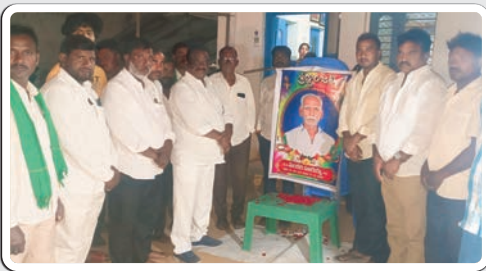
అడ్డగూడూర్ జనవరి 17 (ప్రజాజ్యోతి)