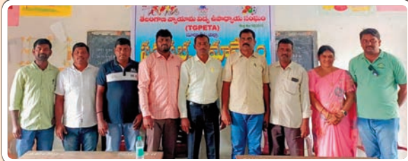
హుజూర్ నగర్ జనవరి 17 (ప్రజాజ్యోతి)