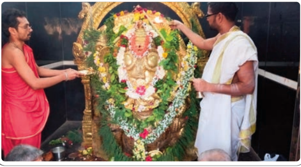
భర్తపురి (జనవరి 17) ప్రజాజ్యోతి: