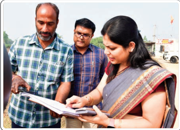
హుజూరాబాద్, జనవరి 17, ప్రజాజ్యోతి:

ఇందిరమ్మ ఇళ్లు, ఇందిరమ్మ ఆత్మీయ భరోసా, రేషన్ కార్డుల జారీ, రైతు భరోసా పథకాలకు లబ్ధిదారుల ఎంపిక పారదర్శకంగా చేపట్టాలని కలెక్టర్ పమేలా సత్యతి అధికారులను ఆదేశించారు. శుక్రవారం హుజూరాబాద్ మండలం సింగపూర్ గ్రామంలో జరుగుతున్న సర్వే కలెక్టర్ పరిశీలించారు. ఈ సందర్భంగా సిబ్బంది