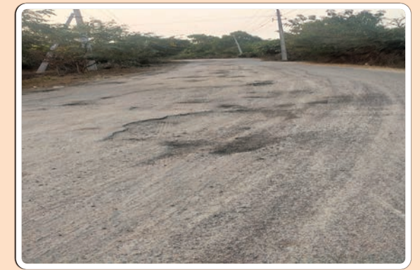
జగిత్యాల రూరల్, జనవరి 17, (ప్రజాజ్యోతి)

జగిత్యాల మండలంలోని మోతె వెల్దుర్తి గ్రామాలకు వెళ్లే రహదారి గుంతలతో ఉండి కంకర తెలి పాదచారులకు, వాహన చోదకులకు, ప్రయాణికులకు, ముఖ్యంగా రాత్రి వేళల్లో ప్రయాణించే వారికి ఇబ్బందికరంగా మారింది అని గ్రామస్థులు, ప్రజలు వాపోతున్నారు అధికారులు స్పందించి ఈ రోడ్డులో గల గుంతలను రోడ్డును సరి చేసి ప్రజల ఇబ్బందులను తీర్చాలని కోరుకుంటున్నారు.