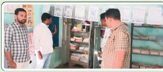
ఇల్లందు, జనవరి 17, ప్రజాజ్యోతి:

-లైట్లు, వైరు, స్విచ్ బోర్డులు, గ్యాస్ సిలిండర్ల చోరీ -ప్రాథమిక పాఠశాలలోనూ సామాగ్రి చోరీ