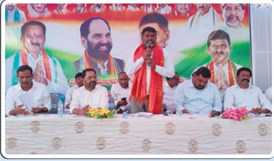
(మొదటి పేజీ తరువాయి...)