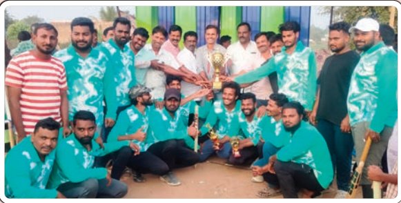
అభ్యవల్లి, జనవరి 17, ప్రజాజ్యోతి