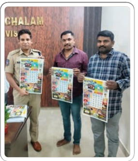
భద్రాచలం, జనవరి 17 (ప్రజాజ్యోతి):

క్యాలెండర్ ఆవిష్కరణలో భద్రాచలం ఎమ్మెల్యే, ఏఎస్పి, ఆర్డీవో