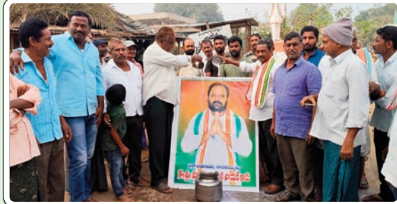
జూలూరుపాడు, జనవరి 17 ప్రజాజ్యోతి:

ఎమ్మెల్యే రాందాస్ నాయక్ చిత్రపటానికి పాలాభిషేకం