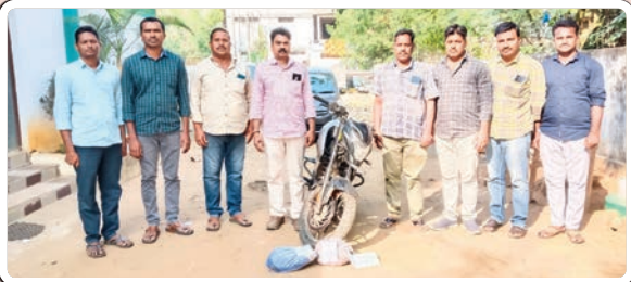
భద్రాచలం, జనవరి 17 (ప్రజాజ్యోతి):