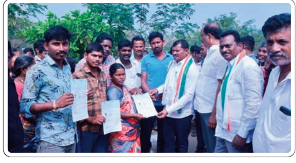
కూల నిర్ణయాలు తీసుకుంటుందని, ఆర్థికంగా వెసులుబాటు లేకున్నా చిన్న ప్రతి హామీని అమలు చేసే దిశగా అదుగులు వేస్తుందన్నారు. ఇందిరమ్మ