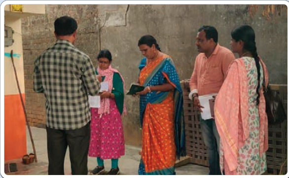
టేకులపల్లి, జనవరి 17, ప్రజాజ్యోతి:

ఇందిరమ్మ ఇళ్ల సర్వేను, రేషన్ కార్డుల సర్వేను పరిశీలించిన జిల్లా అదనపు కలెక్టర్