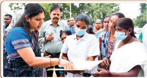
కరీంనగర్ బ్యారో, జనవరి 16, (ప్రజాజ్యోతి)