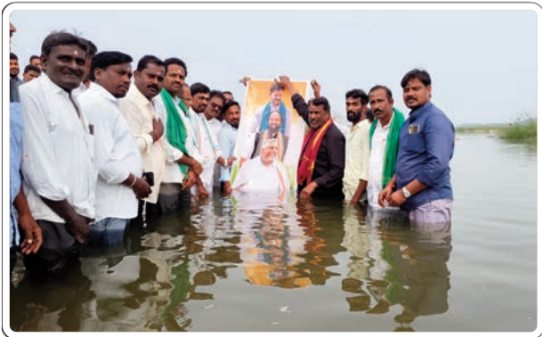
ధర్మపురి (జనవరి 16) ప్రజా జ్యోతి: