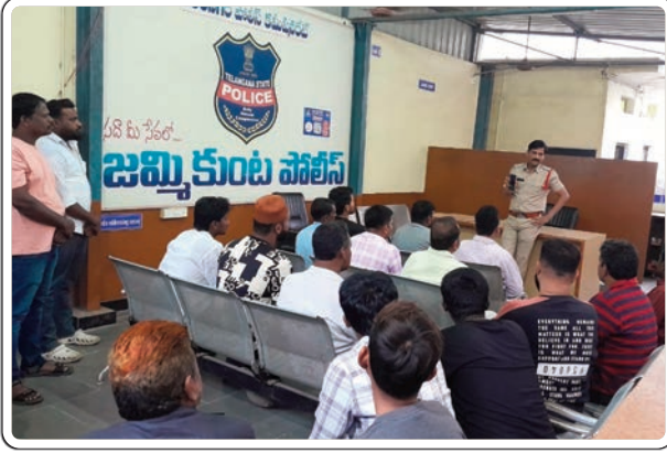
జమ్మికుంట, జనవరి 16, (ప్రజాజ్యోతి):