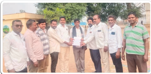
చిగురుమామిడి జనవరి 16 (ప్రజాజ్యోతి)