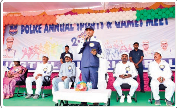
జగిత్యాల బ్యూరో జనవరి 16 ప్రజాజ్యోతి: