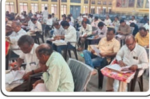
చొప్పదండి, జనవరి 16 ప్రజాజ్యోతి: