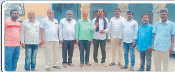
సుల్తానాబాద్ జనవరి 16