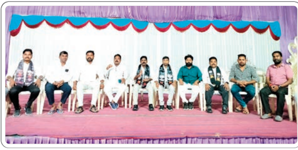
: రాయికల్, జనవరి 16 ప్రజాజ్యోతి

జగిత్యాల జిల్లాకేంద్రంలో మందకృష్ట మాదిగ సభను విజయవంతం చేయండి