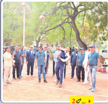
2 లో... >