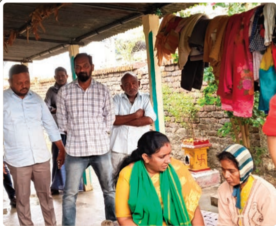
జగిత్యాల రూరల్, జనవరి 16