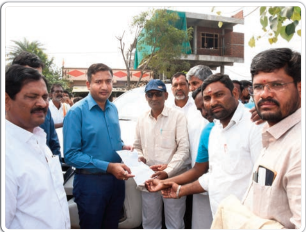
మిగతా 2లో... ▶