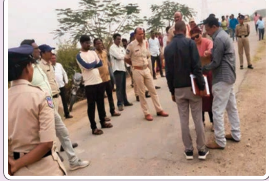
బెల్లంపల్లి, జనవరి 16