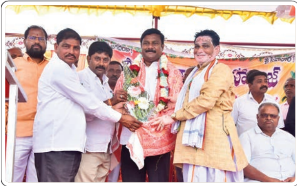
నిర్మల్ అర్చన జనవరి 16 (ప్రజాజ్యోతి)