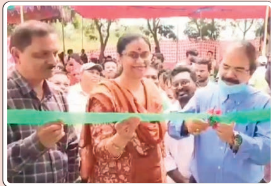
బెల్లంపల్లి, జనవరి 16(ప్రజాజ్యోతి)