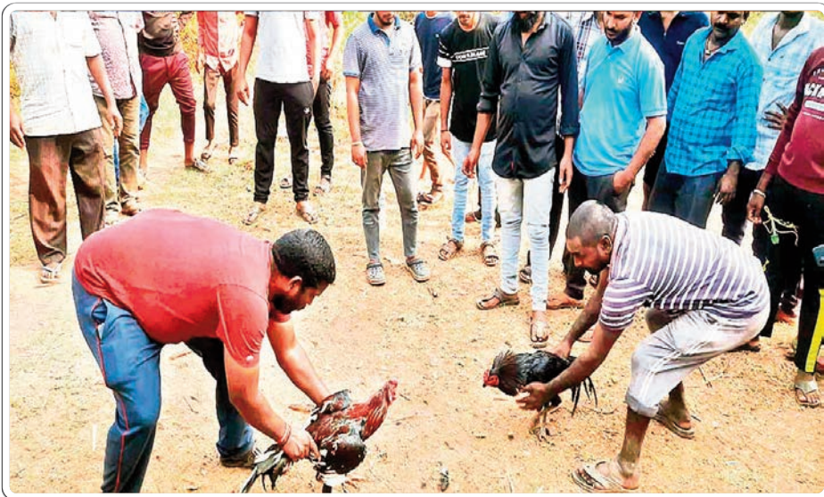
అశ్వాపురం, జనవరి 13 ప్రజా జ్యోతి:

అంతేకాదు ఈ సమయంలో రైతులకు పంట కూడా చేతికందుతుంది. ఇలా ఒకటి రెండు కాదు. అనేక విశేషాలన్నీ సంబురాల సంక్రాంతి పండుగతో పల్లెటూళ్లన్నీ కళకళలాడుతాయి. అంతేకాదండోయ్ హరిదాసు కీర్తనలు, గాలి పటాలు, బసవన్న చిందులు, భోగి మంటలతో సంక్రాంతి పండుగ ప్రారంభమవుతుంది. సూర్యుడు మకర రాశి లోకి ప్రవేశించే సమయంలో మకర సంక్రాంతి పండుగ ప్రారంభమవుతుంది. ఈ ఏడాది జనవరి 15వ తేదీన సోమవారం నాడు ఈ పండుగ వచ్చింది