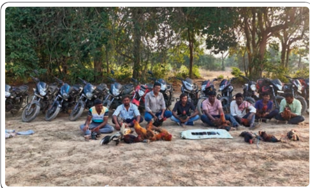
టేకులపల్లి, జనవరి 13, ప్రజాజ్యోతి:

ఎనిమిది మంది అరెస్ట్, 16 మోటార్ సైకిల్స్, 8 ఫోన్లు, 18 కోడిపుంజులు స్వాధీనం