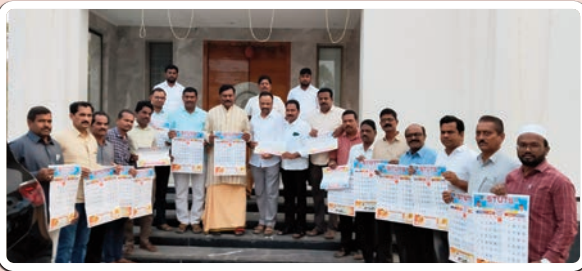
నిర్మల్ టౌన్ జనవరి, 13 (ప్రజాజ్యోతి)