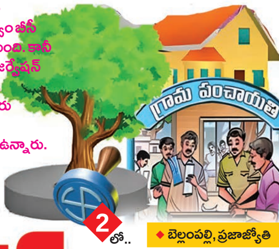
2లో.. > బెల్లంపల్లి, ప్రజాజ్యోతి