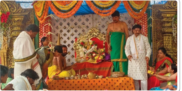
రామకృష్ణాపూర్, జనవరి 13 (ప్రజాజ్యోతి):