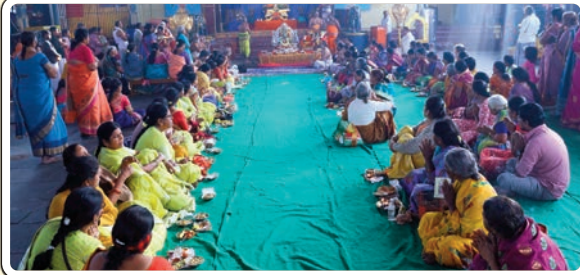
భద్రాచలం, జనవరి 11 (ప్రజాజ్యోతి):

భద్రాచలం శ్రీశీతారామచంద్రస్వామి దేవస్థానంలో ధనుర్మాస ఉత్సవాలలో భాగంగా శనివారం కుడారై ఉత్సవాన్ని సాంప్రదాయబద్ధంగా దేవస్థానం వైదిక,