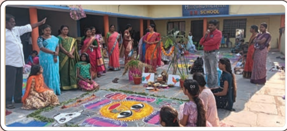
ఇల్లందు/జనవరి 11, (ప్రజాజ్యోతి):

ఆకట్టుకున్న రంగవల్లులు, కైట్స్ ఫెస్టివల్