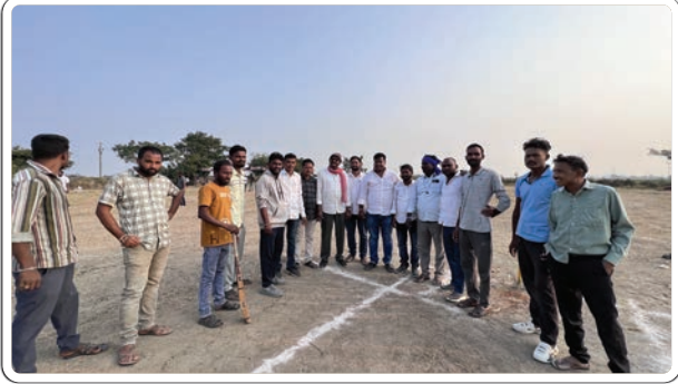
కొటాల, జనవరి 11 (ప్రజాజ్యోతి)