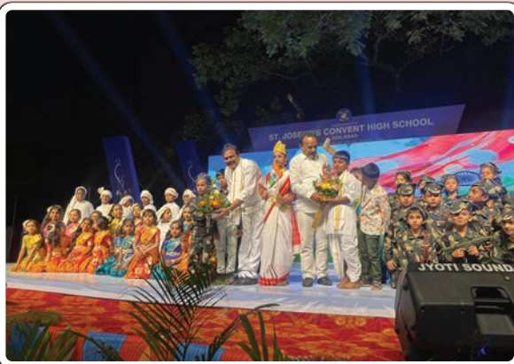
ఆదిలాబాద్ బ్యూరో జనవరి 11, (ప్రజాజ్యోతి)