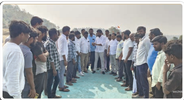
బోధ్, జనవరి 11 (ప్రజాజ్యోతి)

గెలిస్తే గర్వం - ఓడితే నిరాశ చెందొద్దు, - ఆటను ఆస్వాదించాలి - గెలుపు క్రికెట్ ఆటది, - బోధ్, ఎమ్మెల్యే అనిల్ జాడవ్