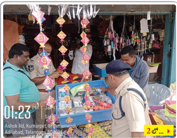
01:23 PM Jan 11 Sat Ashok Rd, Kumarpet, Brahmanwadi, Adilabad, Telangana 504001