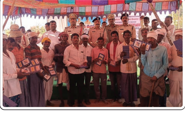
(మొదటి పేజీ తరువాయి...)

సంసిద్ధంగా ఉంటుందని తమ పిల్లలు చదువుకొని జీవితంలో ఉన్నత స్థానాలకు చేరుకోవాలని కోరుకుంటుందని, గిరిజనులకు ఎల్వేశలా క్షేత్రస్థాయి పోలీస్ అధికారులు అందుబాటులో ఉండి వారికి ప్రతి విషయంలో తోడ్పాటును అందిస్తూ వారి ఉన్నతికి కృషి చేయాలని సూచించారు. గిరిజనులను విద్య, వైద్యం వంటి కనీస సౌకర్యాలు కల్పించి వారి ఉన్నతికి తోడ్పడడానికి పోలీస్ శాఖ ఎల్వేశల సంసిద్ధంగా ఉంటుంది అని తెలిపారు. ప్రభుత్వం అందించే వివిధ లబ్ధికార్యక్రమాలను గిరిజనులకు చేరే వేయాడానికి పోలీస్ శాఖ ప్రభుత్వం అన్ని శాఖల సమన్వయంతో సంసిద్ధంగా ఉందని అన్నారు. గిరిజనుల అమాయకత్వాన్ని ఆసరాగా చేసు