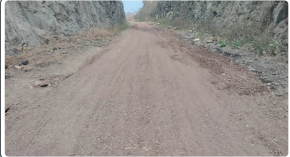
బోధ్, జనవరి 11 (ప్రజాజ్యోతి)

బోధ్ ప్రాంత చుట్టుపక్కల గ్రామాల ప్రజలు ఇతర ప్రాంతాల నుండి ప్రసిద్ధ పుణ్యక్షేత్రమైన అడెల్లి పోచమ్మను దర్శించుకోవడానికి దూర భారం తగ్గుతుంది అనే ఉద్దేశంతో బోధ్ మండలంలోని కుచులపూర్ దన్నూరు బి మీదుగా అడెల్లి పోచమ్మ దర్శించుకోవడానికి దగ్గరి మార్గం ఉండటం మూలంగా ప్రయాణికులు