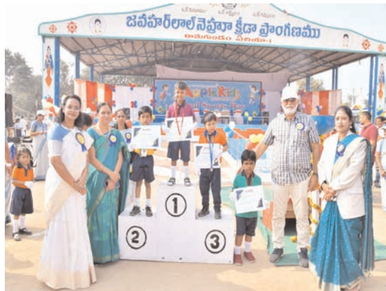
సంబంధం లేకుండా ప్రతి ఒక్క విద్యార్థి క్రీడల్లో ఆటల్లో పాల్గొనాలని సూచించారు.

వేడుకలను ప్రారంభించారు. ఈ సందర్భంగా వారు మాట్లాడుతూ చిన్నతనం నుండే క్రమశిక్షణను అలవాటు చేయడం మరింత ముఖ్యమని, ఆటల ద్వారా శారీరకంగా ఎదిగి ఆరోగ్యంగా ఉండడమే కాక మానసిక వికాసం కలుగుతుందని, చదువులో రాణిస్తూ, అన్ని ఈవెంట్స్ లో వైపుణ్యం చూపిస్తారన్నారు. గెలుపు ఓటములతో