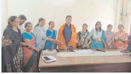
రాష్ట్రంలో ముందు వరుసలో నిలిచామని ఆయన అన్నారు. నల్ల బిల్లు వసూలులో స్టేట్ లో మూడో స్థానం.. - 2లో..