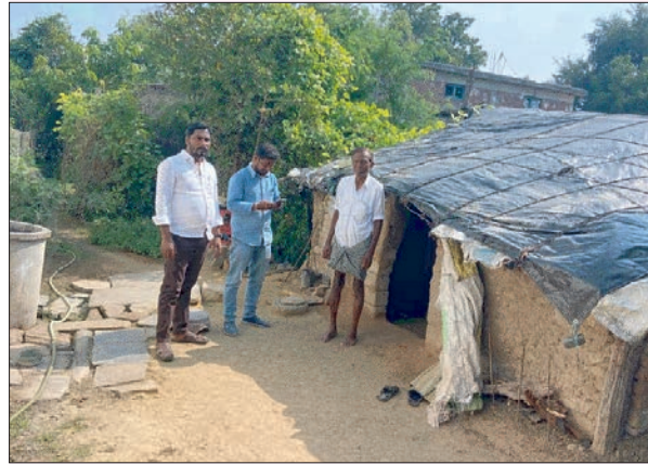
ఇందిరమ్మ రాజ్యంలో-ఇంటింటా సౌభాగ్యం