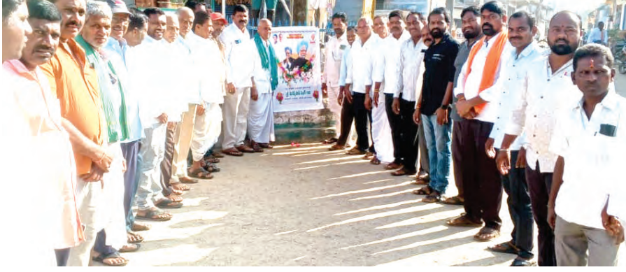
మేట్ పల్లి, డిసెంబర్ 28, ప్రజాజ్యోతి : మండల లోని బండలింగపూర్ గ్రామంలో శనివారం కాంగ్రెస్ పార్టీ అధ్యక్షులు