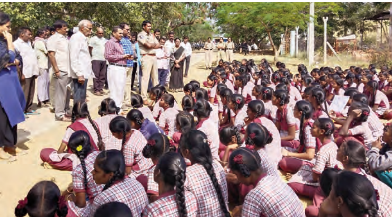
పాఠాలు బోధించేలా చర్యలు తీసుకోవాలని వారు వల్ల తాము విద్యాలయంలో ఆవాసం ఉండలేకపోతున్నామని, తమకు ఎల్లప్పుడూ తోడు

జన్మదినం 28 (ప్రజా జ్యోతి) మా టీచర్లు మాకు కావాలంటూ శనివారం రోజు కస్తూరిబా గాంధీ విద్యాలయం విద్యార్థినులు నియోజకవర్గంలోని నవాబుపేట మండల కేంద్రంలో మండల పరిషత్ కార్యాలయం ముందు గల మైదానంలో ధర్మా చేశారు. ఈ సందర్భంగా విద్యార్థులు తమ గోడు వెళ్ళబోతున్నారని, సుమారు 20 రోజులుగా తమ పాఠశాల ఉపాధ్యాయుల ధర్మా చేస్తుండడం వల్ల తమకు పాఠాలు బోధించేవారు లేకుండా పోయారని వారు ఆవేదన వ్యక్తం చేశారు. పరీక్షలు సమీపిస్తున్న ఈ సమయంలో పాఠాలు బోధించకుండా తాము ఎలా చదువుకోవాలని వారు ప్రశ్నించారు. ఇప్పటికే పోర్టల్ చాలా వెనుకబడి ఉన్నామని, అధికారులు చేసిన ప్రత్యామ్నాయ ఏర్పాట్లు సత్ఫలితాలను ఇవ్వడం లేదని, ఇలాగే విద్యాలయంలో విద్యా బోధన కొనసాగితే తమ ఉత్తీర్ణత ప్రశ్నార్థకంగా మారుతుందని వారు కన్నీరు ముసిరయ్యారు. అధికారులు ప్రభుత్వం వెంటనే స్పందించి తమ ఉపాధ్యాయుల దిమాండ్లను అంగీకరించి వారితో సమ్మతి