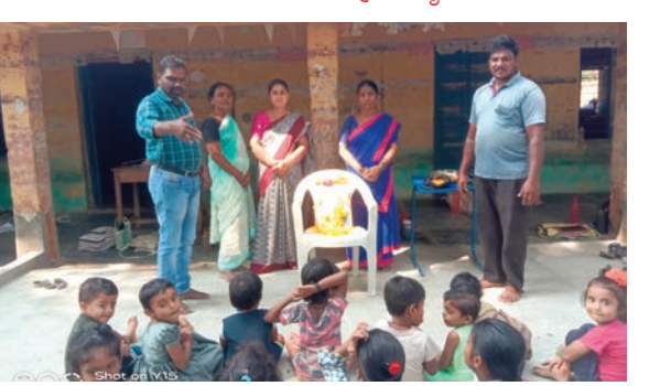
డాక్టర్. బి. ఆర్. అంబేద్కర్ వర్ధంతి సందర్భంగా, ప్రాథమిక పాఠశాల