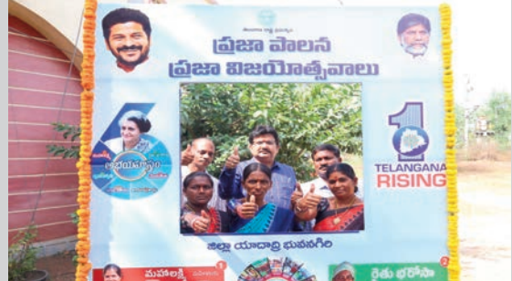
సంబంధిత అధికారులు పాల్గొన్నారు.