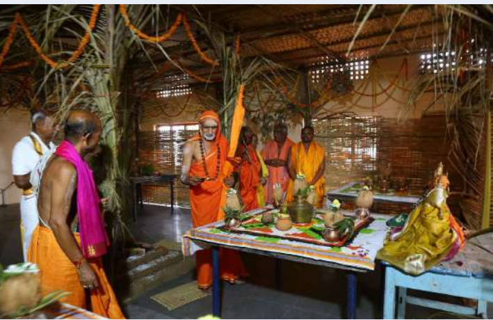
గద్వాల డిసెంబర్ 07(ప్రజా జ్యోతి ప్రతినిధి):