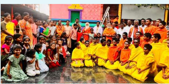
జహీరాబాద్, డిసెంబర్ 08 ( ప్రజా జ్యోతి న్యూస్ )