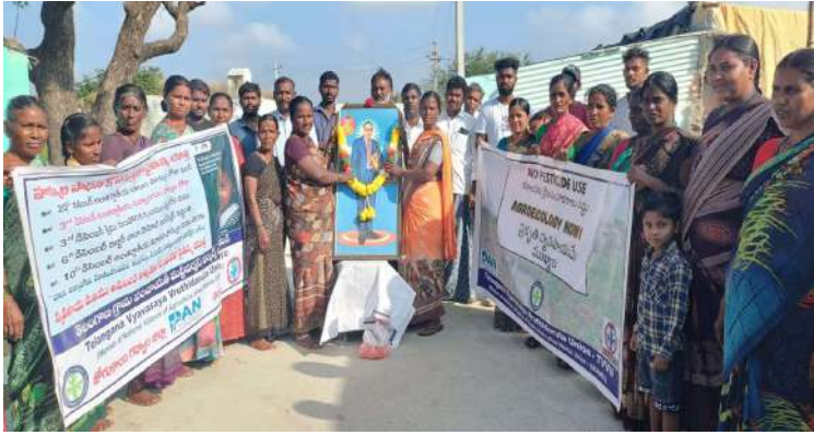
గద్వాల ( ప్రజా జ్యోతి) డిసెంబర్ 06:

గట్టు మండలం మాచర్ల గ్రామంలో భారతదేశ రాజ్యాంగ నిర్మాత డాక్టర్ బి.ఆర్ అంబేద్కర్ 68వ వర్ణంతి కార్యక్రమం తెలంగాణ వ్యవసాయ వృత్తిదారుల యూనియన్ ఆధ్వర్యంలో శుక్రవారం రోజున ఘనంగా నిర్వహించడం జరిగింది. జిల్లా ప్రధాన కార్యదర్శి మాట్లాడుతూ, జీవకోటికి జీవరాశులకు హాని కలిగించు విషపూరితమైన క్రిమిసంహారక మందులను నిషేధించాలి ప్రకృతి వ్యవసాయం చాలా మంచిది క్రిమిసంహారక మందులు వలన చిన్నపిల్లల, గర్భిణీ స్త్రీలు మరియు వయసు పైబడిన వారిపై క్రిమిసంహారక మందులు పెరాసిన్ మెదడు వ్యాధి వ్యాధి గర్భకోశ వ్యాధులు వివిధ రకాల అనారోగ్యానికి గురిచేస్తున్నాయి ప్రస్తుత డోసర్ల ద్వారా రసాయనిక మందులను పిచికారి చేస్తున్న సమయంలో మందులు గాలిలో కలిసిపోవడం వలన వ్యవసాయ అనుబంధ రంగాలలో కూలి పని చేస్తున్న కూలీలు గాలిని స్వావించడం వలన 24 గంటలు తీరకముందే దగ్గు కళ్ళు మొఖము మంటలు రావడము అల్లర్ల తయారు కావడం మొదలగున అనారోగ్యానికి గురి