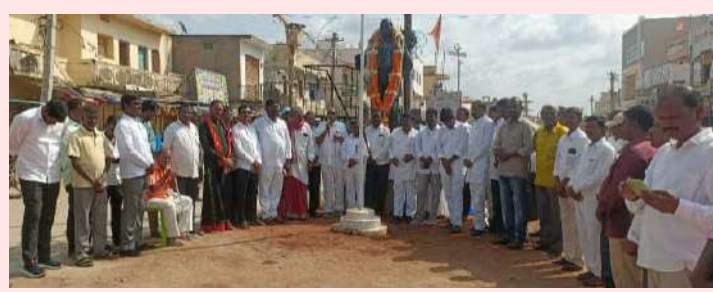
కుల్చవర్ల, డిసెంబర్ 6,(ప్రజా జ్యోతి)