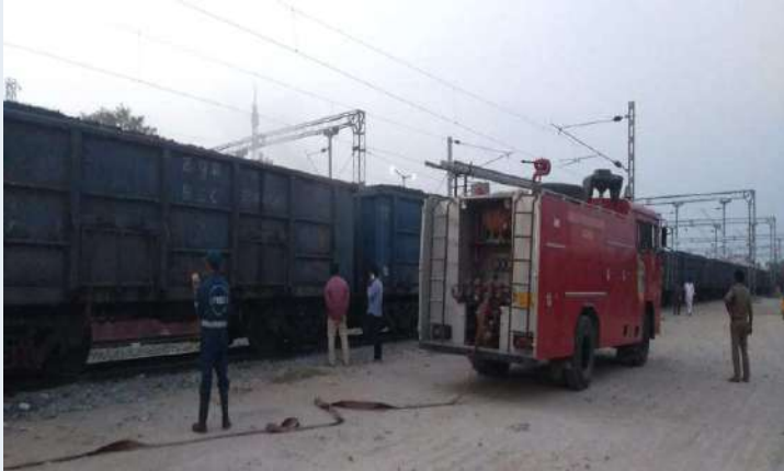
జడ్చర్ల డిసెంబర్ 6 (ప్రజా జ్యోతి)

-భాజీపేట నుండి బొగ్గులోడుతో రైచూర్ వెళ్తుండగా జడ్చర్లలో ఘటన