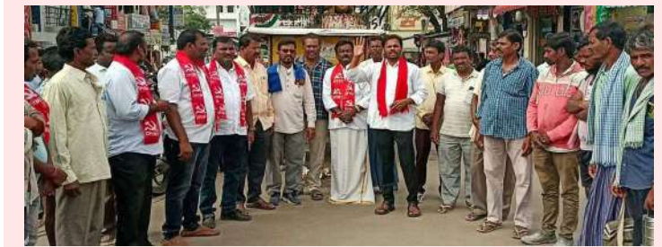
యాచారం, డిసెంబర్ 06 (ప్రజాజ్యోతి):