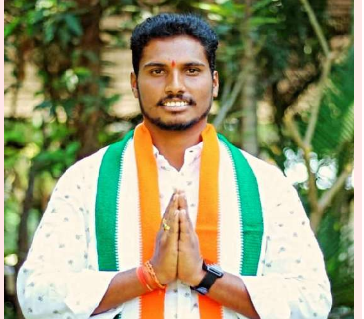
రాయపోల్ డిసెంబర్ 6 ప్రజా జ్యోతి