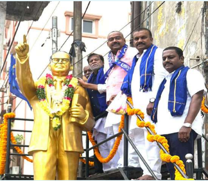
బాలానగర్, డిసెంబర్ 06 (ప్రజా జ్యోతి) :