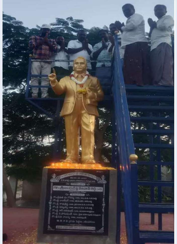
గద్వాల (ప్రజా జ్యోతి) డిసెంబర్ 06: