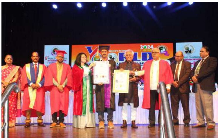
-మీడియా రంగంలో దశాబ్దకాలంగా సేవలందిస్తున్న