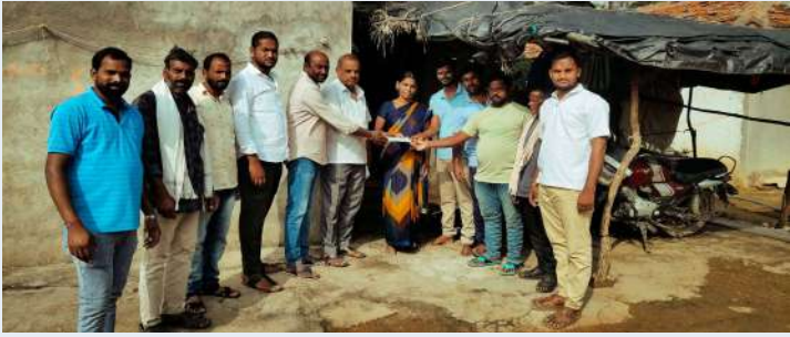
రాయచోట్ డిసెంబర్ 4 ప్రజా జ్యోతి.