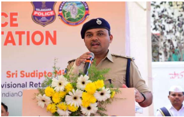
-కలెక్టర్ బాదావత్ సంతోష్

నాగర్ కర్నూల్ డిసెంబర్ 4 (ప్రజా జ్యోతి ప్రతినది)