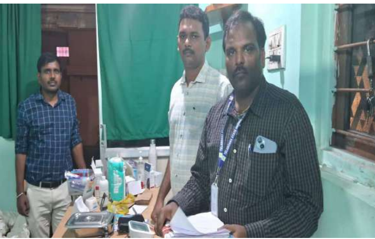
మేడ్చల్ జిల్లా ప్రతినిధి / ఉప్పల్ డిసెంబర్ 4 (ప్రజాజ్యోతి)