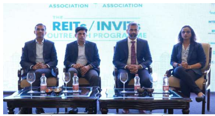
సెలెక్ట్ ట్రస్ట్ అనే నాలుగు పబ్లిక్ లిస్టెడ్ రియల్ ఎస్టేట్ ఇన్వెస్ట్మెంట్ ట్రస్టులు(రీట్స్) మన దేశంలో పబ్లిక్ గా లిస్ట్ అయి ఉన్నాయన్నారు. ఇన్ఫ్రాస్ట్రక్చర్ ఇన్వెస్ట్మెంట్ ట్రస్టులు(ఇన్వెస్ట్) రోడ్డు, పంపిణీ, పైప్ లైన్లు, టెలికాం, వేర్ హౌసింగ్ లాంటి వివిధ మౌలిక సదుపాయాల రంగాలలో ఆదాయాన్ని సృష్టించే ఆస్తులను కలిగి ఉన్నాయన్నారు.

ద ఇండియన్ రీట్స్ అసోసియేషన్(ఐఆర్ఏ), భారత్ ఇన్వెస్ట్ అసోసియేషన్(బీఐఏ) సంయుక్తంగా మొట్ట మొదటి ఉత్పత్తి అవగాహన కార్యక్రమాన్ని హైదరాబాద్ లో నిర్వహించినట్లు ఇండియన్ రీట్స్ అసోసియేషన్ ప్రతినిధులు బుధవారం ఒక ప్రకటనలో పేర్కొన్నారు. వారు మాట్లాడుతూ ప్రధానంగా రియల్ ఎస్టేట్ ఇన్వెస్ట్మెంట్ ట్రస్టులు(రీట్స్), ఇన్ఫ్రాస్ట్రక్చర్ ఇన్వెస్ట్మెంట్ ట్రస్టులు(ఇన్వెస్ట్) గురించి పెట్టుబడిదారుల్లో అవగాహన పెంచేందుకు ఈ కార్యక్రమం నిర్వహించినట్లు తెలిపారు. పెట్టు బడిదారులకు అవగాహన కల్పించడం, రీట్స్, ఇన్వెస్ట్ స్వీకరణను ప్రోత్సహించడం, ఆపరేటింగ్, రెగ్యులేటరీ వాతావరణాన్ని బలోపేతం చేయడం, క్యాపిటల్ మార్కెట్లను బలోపేతం చేయడం, మొత్తం ఇన్వెస్టర్ అవగాహనను పెంచడం ఈ కార్యక్రమం లక్ష్యం అన్నారు. బ్రూక్ ఫీల్డ్ ఇండియా రియల్ ఎస్టేట్ ట్రస్ట్, ఎంబీఐ ఆఫ్ టెక్నాలజీ ఆర్ఈఐటీ, మైండ్ స్పేస్ బిజినెస్ పార్ట్నర్ ఆర్ఈఐటీ, నెక్స్ట్