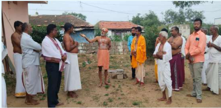
కొల్చారం (ప్రజాజ్యోతి) డిసెంబర్ 4 :