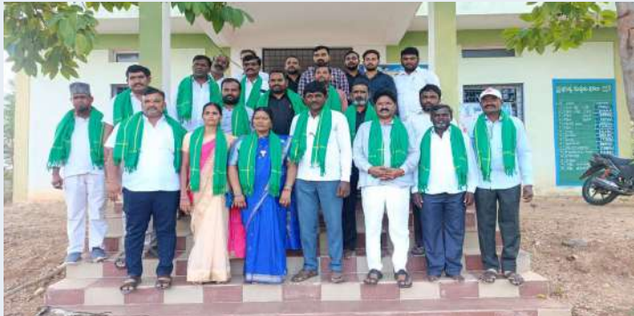
కోహెడ డిసెంబర్.04 (ప్రజా జ్యోతి)

-చైర్మన్గా.. బోయిని నిర్మల జయరాజు బాధ్యతలు స్వీకరణ